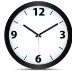
Saat kaçta buluşalım?