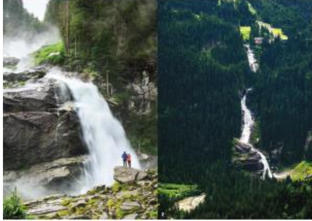
1. Wasserfälle sind ein wichtiger Bestandteil der Landschaft. Sie sind nicht nur schön anzusehen, sondern auch ein wichtiger Bestandteil der Landschaft. Sie sind nicht nur schön anzusehen, sondern auch ein wichtiger Bestandteil der Landschaft.