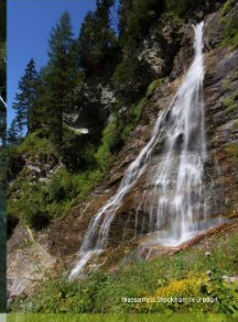
Wassersprinkler in Krimml