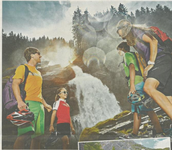
Die Krimmler Wasserfälle werden auch erfolgreich zur Asthma-Therapie eingesetzt. Die Wassertröpfchen wirken wie ein natürliches Spray.

Der erste Schritt fällt oft schwer. Die Angebote sind vielseitig, eines verlockender als andere. Eine einfühlsame Begleitung auf dem Weg zum individuellen Wohlbefinden ist deshalb ein sehr wichtiges Angebot der Alpen Gesundheitsregion Salzburg. Die Behandlungen fügen sich harmonisch in die Urlaubswünsche des einzelnen Gastes ein und werden zu einem wichtigen Mosaikstein seiner gelungenen Auszeit vom Alltag. Gezielte Bewegung und Therapien, eingebettet in die kraftvolle Natur des Nationalparks Hohe Tauern, wirken wie ein Jungbrunnen. www.salzburgerland.com