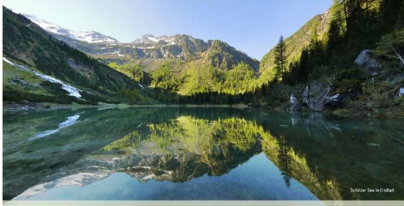
Schöckl-See in Gröden