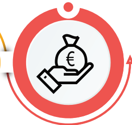
Підвищення економічної ефективності