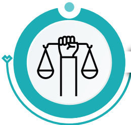
Повага до прав людини та задоволення основних потреб

Існує широкий консенсус щодо оцінювання ефективності альтернатив триманню мігрантів під вартою на основі таких трьох критеріїв: