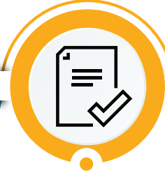
Забезпечення дотримання міграційних процедур