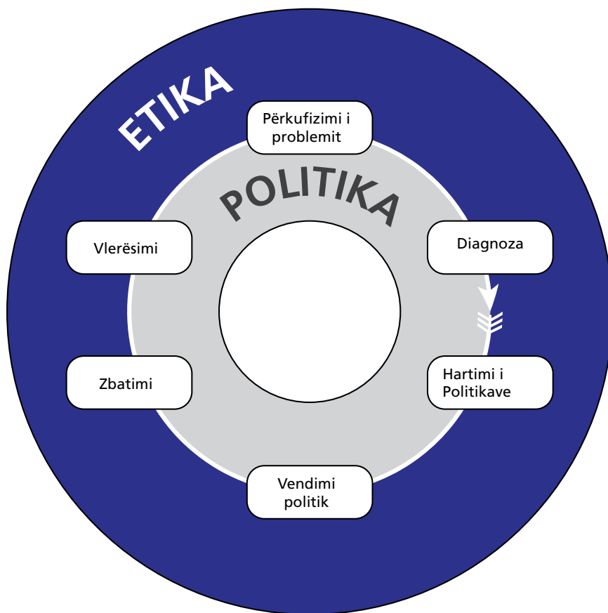
Figura 1. Cikli i politikës. 12

Përgjigjja më e efektshme dhe e qëndrueshme kundër dhunës ndaj fëmijës është një kuadër shumëdisiplinor dhe sistematik i integruar në procesin kombëtar të planifikimit, bazuar në KKBDf-ënë dhe i përshtatur për standardet e Këshillit të Evropës për të drejtat e njeriut. Gjithashtu, ajo duhet të bashkojë gjithë palët përkatëse të interesuara. Gjithë aktorët e angazhuar me nxitjen dhe mbrojtjen e të drejtave të fëmijës, autoritetet kombëtare, rajonale dhe vendore, institucionet e pavarura të të drejtave të njeriut, profesionistët që punojnë për dhe me fëmijët, studiuesit, shoqëria civile dhe mediat duhet të përfshihen në hartimin, zbatimin dhe vlerësimin e strategjisë. Fëmijët jo vetëm që duhen dëgjuar, por ata duhen inkurajuar që të kontribuojnë dhe që pikëvështrimet e tyre të merren në konsideratë. 13