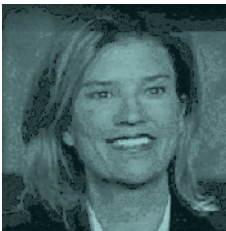
Greta Van Susteren – Depois

Quando a muito respeitada Greta Van Susteren, pivô de um programa noticioso, saiu da CNN para a Fox, no início de 2002, não se limitou a mudar de estilo, tendo-se submetido a uma cirurgia plástica para parecer mais jovem e mais «bonita». Quando o seu novo programa, «On the Record», estreou, o seu cabelo estava perfeitamente penteado e ela sentava-se atrás de uma mesa, para que os espectadores pudessem ver a sua saia curta e as pernas.