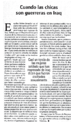
Fonte: Quando las chicas son guerreras en Iraq – Aguilar; www.elsiglodeeuropa.es/siglo/.../790Aguilar.html

Quando las chicas son guerreras en Iraq, de Miguel Ángel Aguilar, El Siglo (on-line), 2 de junho de 2008