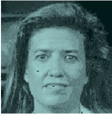
Greta Van Susteren – Antes