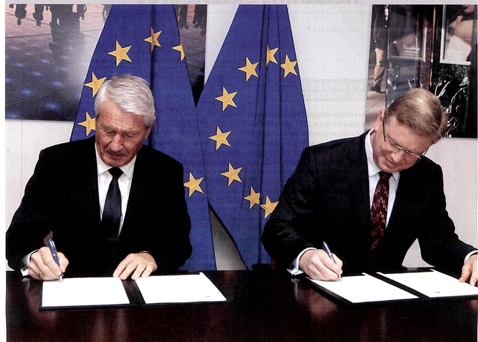
Thorbjørn Jagland , Secrétaire Général du Conseil de l'Europe, et Stefan Füle , Commissaire à l'élargissement et à la politique européenne de voisinage (UE), signent un nouveau cadre de coopération à long terme