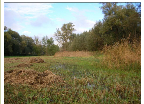
La prairie humide à la fin de l'été (2007) Natte weide op het einde van de zomer (2007)