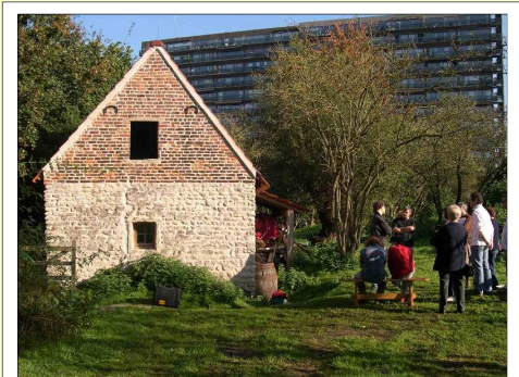
Un témoin du passé ancré dans le XXI ème siècle. Een getuige van het verleden verankerd in de XXI ste eeuw.

La CEBE-MOB (Commission de l'Environnement de Bruxelles et Environs asbl - Milieu Commissie Brussel en Omgeving vzw) est une association sans but lucratif née en 1989 et composée uniquement de bénévoles.