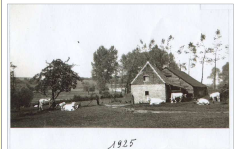
Het bakhuis in 1925 Le fournil en 1925

A quelques pas de la ferme, s'élève le fournil, petit bâtiment de quelques mètres carrés. Éloigné du corps de ferme pour éviter les incendies, le pain y était cuit pour les habitants de la ferme et pour la population des environs. Depuis 2007, des fournées y sont à nouveau organisées. Le paysage se complète par un moulin à vent. Datant de 1760, il était installé dans l'ouest de la Belgique. Réédifié en 1964 sur le site, il fut détruit par un incendie en 1980. Sa réplique fut construite en 1988.