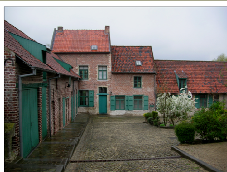
L'intérieur de la cour en 2005 De binnenkoer in 2005