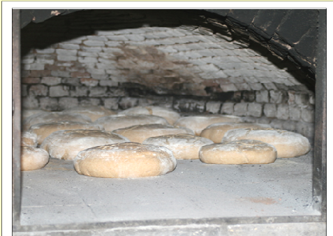
Une nouvelle vie : la fournée est réussie. Een nieuwe leven : het baksel is geslaagd