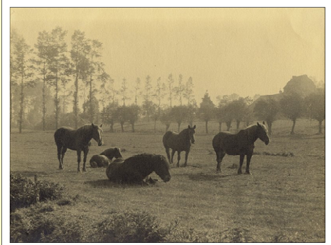
Les prairies le long de la Woluwe dans les années '60 De weiden langs de Woluwe in de jaren '60

Un chemin, accessible à tous, délimite le périmètre de ce site Natura 2000.