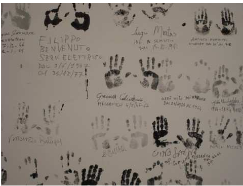
Museo del Carbone - Carbonia

Nell'ambito del convegno sono stati proposti workshop e una mostra dei progetti della selezione italiana che sarà integrata con la pubblicazione scientifica degli esiti di questo incontro. Accanto al Forum COE, il MiBAC ha presentato e sperimentato una piattaforma di confronto focalizzata sull'esperienza italiana, il Laboratorio Italia , organizzata con l'intenzione di creare un evento a cadenza biennale con l'obiettivo di sintetizzare gli sviluppi dell'applicazione della Convenzione e del Premio.