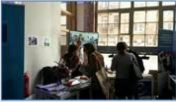
[Le FEJ à Bruxelles]

Le FEJ était présent à la deuxième Convention sur le travail de la jeunesse européenne à Bruxelles , qui s'est déroulé du 27 avril au 30 avril 2015. La Convention a rassemblé plus de 500 travailleurs de la jeunesse, des décideurs politiques, des chercheurs principalement des Etats membres du Conseil de l'Europe, pour débattre des défis à relever auxquels sont confrontés le travail de la jeunesse ; pour passer en revue les évolutions des bonnes pratiques et de la politique dans le domaine du travail de la jeunesse depuis la première Convention en 2010 et « trouver un terrain commun » au sein de la diversité du travail européen afin de favoriser la reconnaissance du travail de la jeunesse.