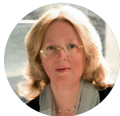
Mechthild RÖSSLER Ancienne directrice du Centre du patrimoine mondial de l'UNESCO