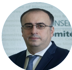
Amb. Irakli GIVIASHVILI Représentant Permanent de la Géorgie auprès du Conseil de l'Europe