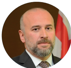
Zviad SHALAMBERIDZE Gouverneur de la Région d'Iméréthie