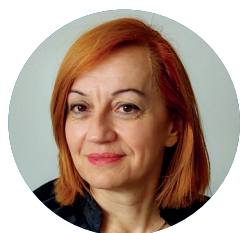
Tatjana HORVATIĆ Directrice du Bureau du Patrimoine culturel ethnographique et immatériel, Direction de la Protection du patrimoine culturel, Ministère de la Culture et des Médias de la République de Croatie