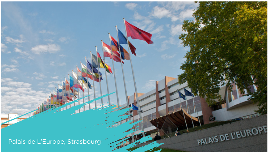
Palais de L'Europe, Strasbourg