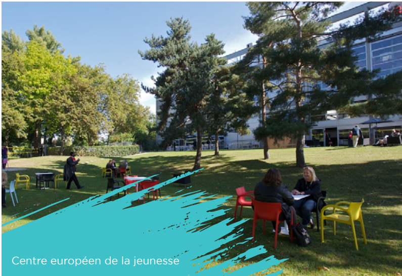
Centre européen de la jeunesse

19h00 Dîner au Centre européen de la jeunesse