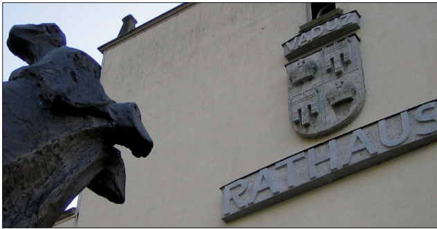
Rathaus in Vaduz, während einer Beobachtungsmission für kommunale Demokratie in Liechtenstein.

Die Anerkennung der kommunalen Demokratie durch die Mitgliedstaaten des Europarats führte 1985 zur Verabschiedung der Europäischen Charta der kommunalen Selbstverwaltung. Dieser Text bestätigt die Gebietskörperschaften als erste Ebene gelebter Demokratie. Die Charta ist der maßgebliche internationale Vertrag in diesem Bereich.