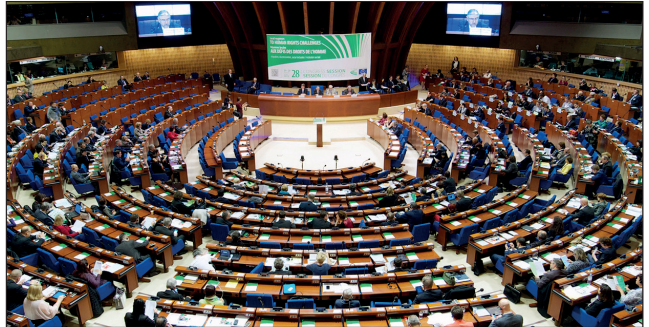
Monitoring-Berichte werden bei Plenarsitzungen des Kongresses debattiert und verabschiedet.

Jede Verwaltungsaufsicht über die Tätigkeit der kommunalen Gebietskörperschaften darf in der Regel nur bezwecken, die Einhaltung der Gesetze und Verfassungsgrundsätze sicherzustellen. Die Verwaltungsaufsicht kann jedoch bei Aufgaben, deren Durchführung den kommunalen Gebietskörperschaften übertragen wurde, eine Kontrolle der Zweckmäßigkeit durch die übergeordneten Behörden umfassen.