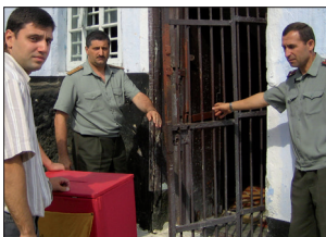
Eine Wahlurne in einem Gefängnis in Chisinau (Moldau). Die Achtung der Bürgerrechte, selbst in Gefängnissen, ist ein Zeichen für die Qualität der kommunalen Demokratie in einem Staat.

Ergebnisse dieser Monitoring-Aktivitäten und Empfehlungen des Kongresses zahlreiche Gesetzesreformen eingeleitet.