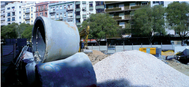
Kommunen brauchen ausreichende Mittel, um z.B. Raumentwicklungsprojekte umzusetzen.