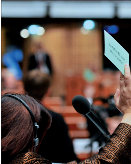
Die freie Ausübung des Amtes der gewählten Vertreter drückt sich auch in der Stimmabgabe aus.

„[ ... ] Unbeschadet allgemeiner gesetzlicher Bestimmungen müssen die kommunalen Gebietskörperschaften in der Lage sein, ihre internen Verwaltungsstrukturen selbst