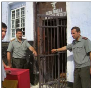
Урна для голосования в тюрьме в Кишиневе (Молдова). Соблюдение гражданских прав, даже в тюрьме, является показателем качества местной демократии в стране.

мероприятий по мониторингу и рекомендаций Конгресса государства-члены осуществили многочисленные законодательные реформы.