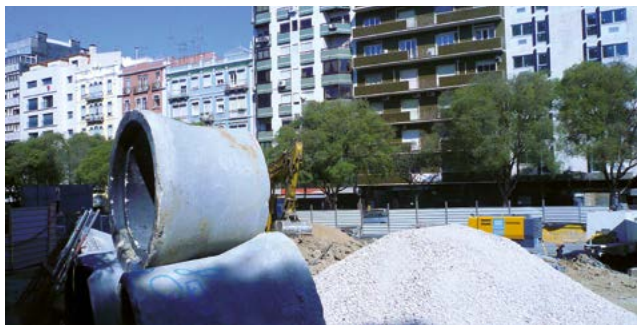
Финансовые средства местного сообщества должны позволять ему, например, осуществлять работы по обустройству территории.

“По мере возможности, субсидии органам местного самоуправления не должны предназначаться для финансирования конкретных проектов. Субсидии не должны подрывать основной принцип свободы определения местными сообществами политики в пределах принадлежащих им компетенций”. (Статья 9.)