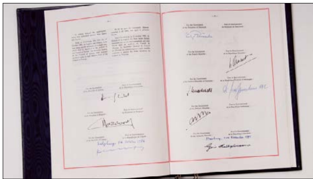
Оригинал Хартии, которая была сдана на хранение в Бюро договоров Совета Европы.

Хартия требует, чтобы принцип местного самоуправления был закреплен в национальном законодательстве и, по возможности, в Конституции, с тем, чтобы обеспечить его действенность. Она также определяет демократические принципы деятельности сообществ.