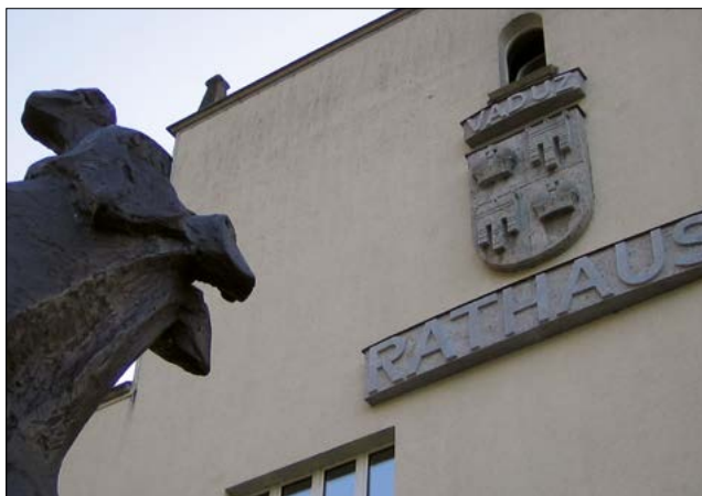
Ратуша города Вадуц. Снято во время миссии по мониторингу местной демократии в Лихтенштейне.

Признание местной демократии государствами-членами Совета Европы привело в 1985 году к принятию Европейской хартии местного самоуправления. В этом документе утверждается роль сообществ как первого уровня демократии. Он стал международно-правовым документом, заложившим стандарты в этой области.