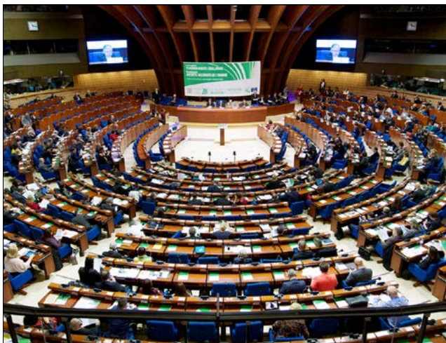
Доклады о мониторинге обсуждаются и принимаются на пленарных сессиях Конгресса.

Административный контроль за деятельностью органов местного самоуправления должен осуществляться с