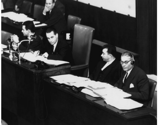
Жак Шабан-Дельма (Франція), перший президент Конференції місцевих влад, 12 січня 1957 р.

Витяг із промови Жака Шабан-Дельма від 12 січня 1957 року