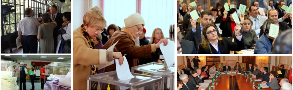
Спостереження за місцевими та регіональними виборами та моніторинг виконання положень Європейської хартії місцевого самоврядування є пріоритетними напрямками діяльності Конгресу.

та резолюції Конгресу надають урядам, парламентам, організаціям, виборним представникам та ЗМІ інформацію про стан місцевої та регіональної демократії в кожній окремій країні, а також про дотримання положень Європейської хартії місцевого самоврядування.