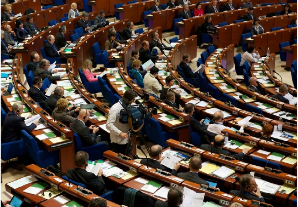
648 місцевих та регіональних представників зустрілися на пленарному засіданні у Страсбурзі (Франція).

Конгрес складається з двох Палат: Палата місцевих влад та Палата регіонів. До складу Конгресу входить 324 постійних членів та 324 заступників, які призначаються строком на 4 роки і представляють понад 150 000 органів місцевих та регіональних влад 47 країн-членів Ради Європи.