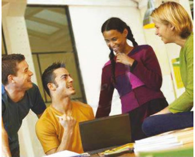
Залучення молоді – один із пріоритетних напрямків діяльності Конгресу

Конгрес також заснував Статутний форум , який складається з голів національних делегацій та 17 членів Бюро, що діють від імені Конгресу у міжсесійний період.