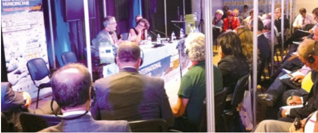
Конгрес організував участь представників Албанії у Міжнародному муніципальному ярмарку в Хорватії в рамках NEXPO-2013.

З метою зміцнення місцевої демократії Конгрес активно розвиває співробітництво та партнерство з країнами-членами та іншими інституційними органами та Європейськими асоціаціями. Конгрес пропонує низку заходів на місцях, спрямованих на виконання положень Європейської хартії місцевого самоврядування та рекомендацій Конгресу.