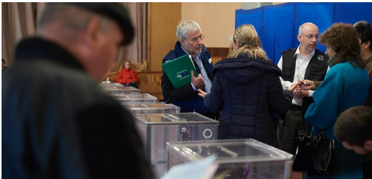
Фото: Миссия по наблюдению за местными и региональными выборами в Украине 25 октября 2015 года

Конгресс местных и региональных властей с 1990 года осуществляет миссии по наблюдению за местными выборами в 47-ми странах-членах Совета Европы и вне его. Миссии проводятся по официальной просьбе заинтересованных национальных органов и дополняют политический мониторинг исполнения Европейской хартии местного самоуправления.