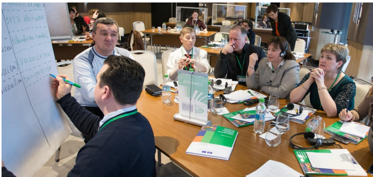
Фото: Семинар "Мэры - лидеры перемен" в Республике Молдова (2 - 4 февраля 2016 года)

Целью мероприятий Конгресса по сотрудничеству является содействие ряду стран-членов в осуществлении Рекомендаций, принимаемых Конгрессом в обеспечение практического решения проблем, выявляемых в ходе мониторинга, постмониторинга и наблюдения за выборами.