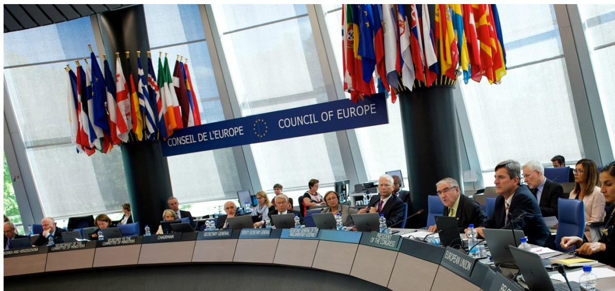
Фото: Заседание Комитета министров Совета Европы