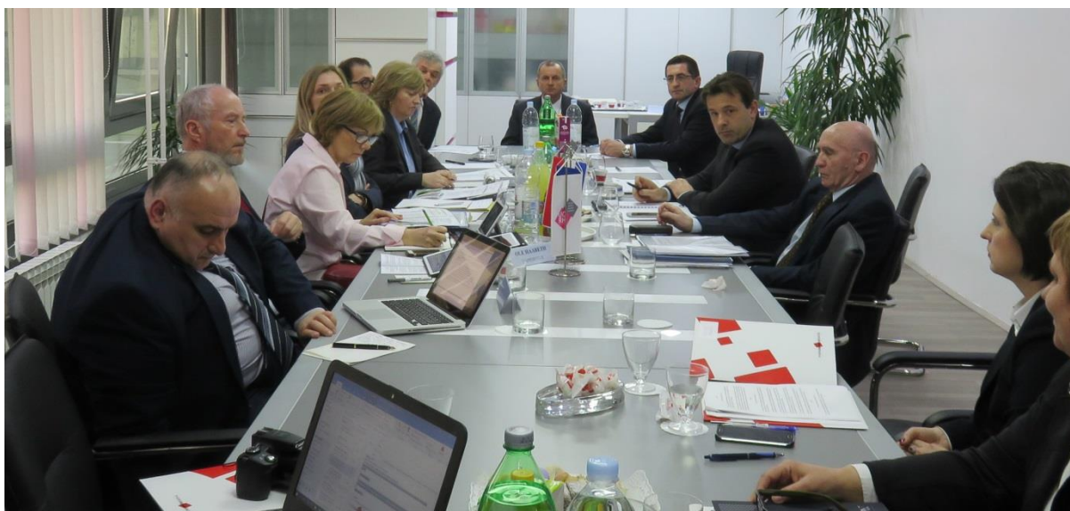
Фото: Мониторинговый визит в Республику Хорватия (2 - 4 марта 2016)

Основная миссия Конгресса местных и региональных властей состоит в эффективном мониторинге состояния местной и региональной демократии в странах-членах Организации путем оценки исполнения принятой в 1985 году Европейской хартии местного самоуправления.