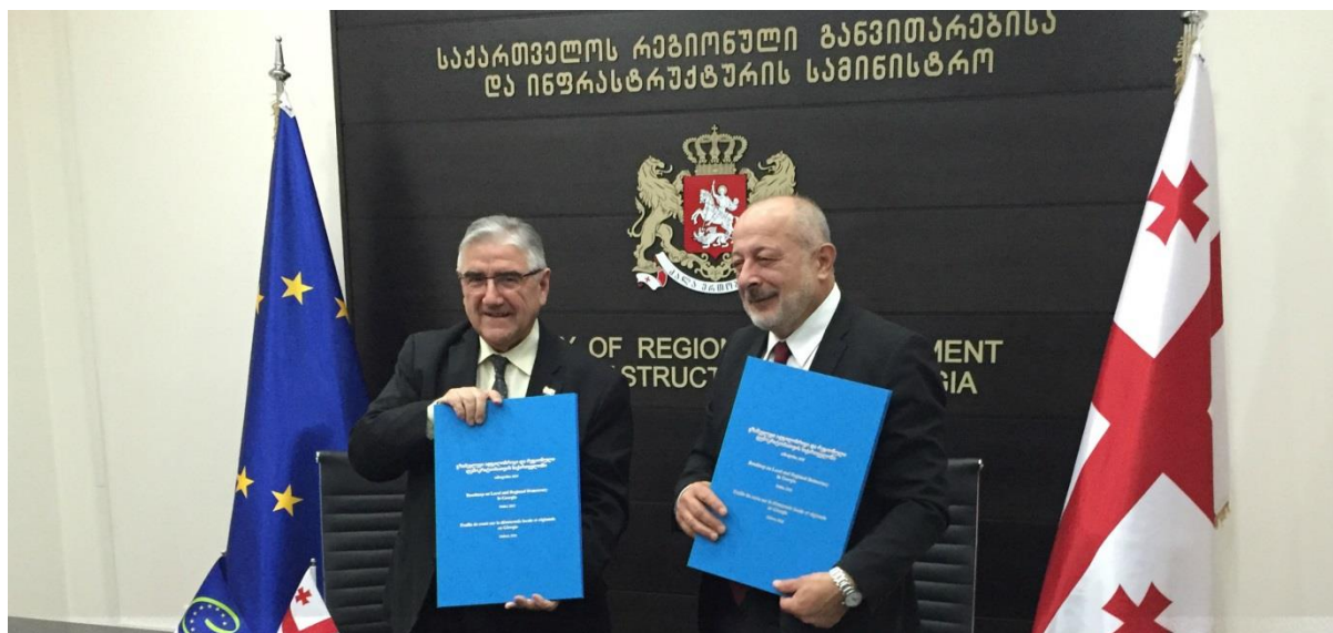
Фото: Председатель Конгресса и президент Грузии Гиоргий Маргвелашвили при подписании дорожной карты 16 декабря 2015 года

Постмониторинг представляет собой процедуру, установленную Конгрессом для обеспечения принятия мер во исполнение странами-членами его Рекомендаций в области местной и региональной демократии с помощью активизации политического диалога между властями страны и Конгрессом. Процедура инициируется по совместному решению властей страны и Конгрессом. По существу, это политический диалог с Конгрессом, касающийся исключительно Рекомендаций, принятых Конгрессом в отношении стран, согласившихся на постмониторинг.