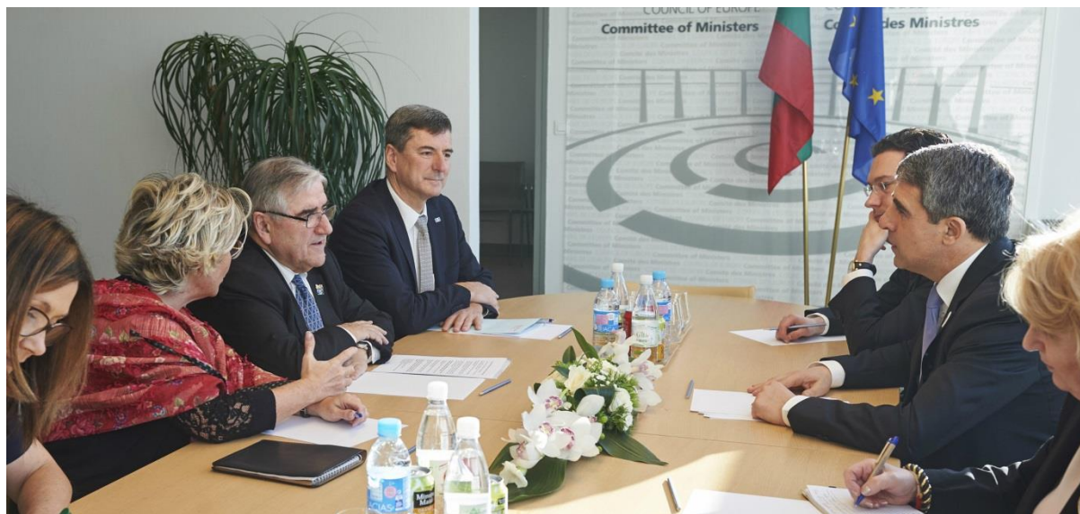
Фото: Председатель Конгресса и президент Болгарии Росен Плевнелиев, 26 января 2016 года

Конгресс принял активное участие в ряде мероприятий, организованных председательством Болгарии в Комитете министров.