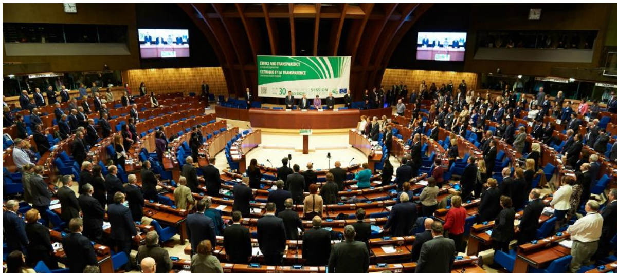
Фото: 30-я сессия Конгресса