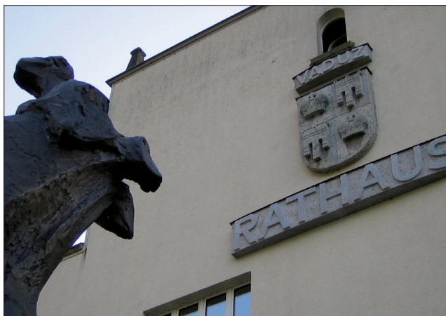
Municipio di Vaduz, foto scattata in occasione di una missione di monitoraggio della democrazia locale nel Liechtenstein.

Il riconoscimento della democrazia locale da parte degli Stati membri del Consiglio d'Europa ha condotto all'adozione, nel 1985, della Carta europea dell'autonomia locale. Il testo sancisce il ruolo delle collettività in quanto primo livello in cui è esercitata la democrazia. È diventato il trattato internazionale di riferimento in questo campo.