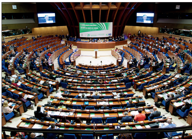
I rapporti di monitoraggio sono discussi e adottati nel corso delle sessioni plenarie del Congresso

La verifica amministrativa delle collettività locali deve essere esercitata nel rispetto di un equilibrio tra la portata dell'intervento dell'autorità di