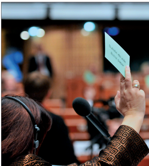
Il libero esercizio del mandato di un amministratore eletto si esprime anche attraverso il voto

Esso deve consentire un adeguato compenso finanziario delle spese derivanti dall'esercizio del loro mandato, nonché, se del caso, un compenso finanziario per i profitti persi, o una remunerazione per il lavoro svolto, nonché un'adeguata copertura sociale.