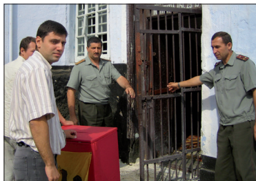
Un'urna elettorale in un carcere di Chisinau (Moldova). Il rispetto dei diritti civili, anche in prigione, è il segno della qualità della democrazia locale in un paese.

Numerose riforme legislative sono state avviate dagli Stati membri in seguito ai risultati delle attività di monitoraggio e delle raccomandazioni del Congresso.