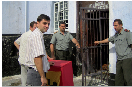
السلطات المحلية شركاء المؤتمر

وتشرف على وسائل الإعلام والمنتخبين المحليين والجمعيات والوضع الديمقراطي المحلي والإقليمي يقوم المؤتمر وبشكل دوري برقابة عامة لكل بلد. ويمكن أن ينظم في عمله مهام تحقيق للمؤتمر تتعلق بمشكلات مقلقة.