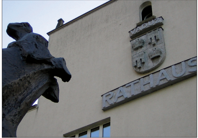
راثوز دي فادوز بمناسبة مهمة مراقبة الديمقراطية المحلية في ليشنتشتاين

على هياكل اتخاذ القرار تشكلت ديمقراطيا وتحظى باستقلال واسع في ما يتعلق بمهامها وطرق ممارستها والموارد الضرورية لإنجازها[...].“