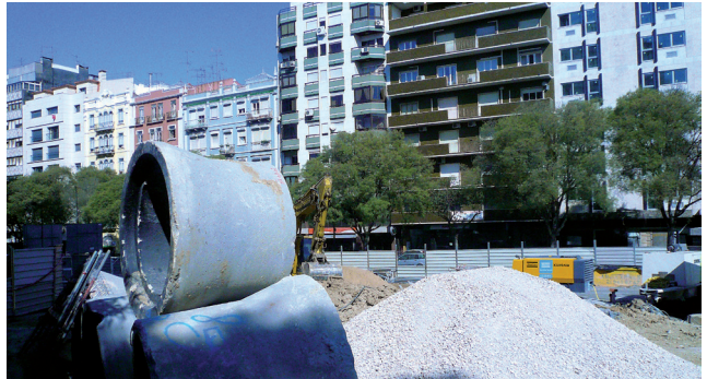
يجب أن تسمح الموارد المالية لجماعة محلية، على سبيل المثال، بإنجاز أعمال الصيانة.