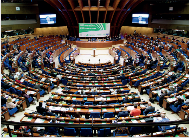
تتم مناقشة تقارير واعتمادها في الدورات العمة للمؤتمر

يضع الميثاق ضمانات لحماية حقوق الجماعات المحلية. على سبيل المثال، حدود الأراضي لا يمكن تغييرها من دون موافقة الجماعات المحلية المعنية، ويجب تنظيم رقابة على نشاطات السلطات المحلية حسب القانون، مع إمكانية اللجوء إلى القضاء