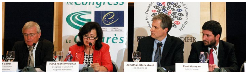
Présentation des conclusions préliminaires conjointes de l'OSCE/BIDDH et du Congrès suite aux élections locales (Albanie, mai 2011).

Le Congrès assure le suivi de ses recommandations par la mise en place de programmes spécifiques et de partenariats avec des institutions clefs œuvrant pour des élections locales et régionales véritablement démocratiques partout en Europe.