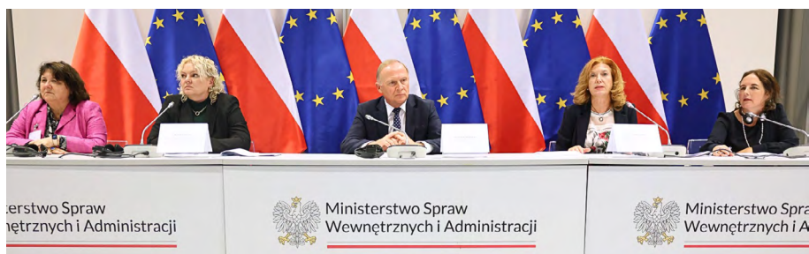
High-level conference marking 20 years of the adoption of the Council of Europe Anti-Trafficking Convention and 30 years of La Strada International, Warsaw, Poland, 18 September 2025

52. Par ailleurs, une conférence à haut niveau a été organisée le 18 septembre 2025, à Varsovie, par le ministère polonais de l'Intérieur et de l'Administration, le Conseil de l'Europe, La Strada International et la Fondation La Strada Pologne, à l'occasion du 20 e anniversaire de la Convention et du 30 e anniversaire de La Strada International. Les participant·es ont souligné les problèmes qui persistent, notamment l'augmentation de la traite aux fins d'exploitation par le travail, le nombre croissant d'enfants victimes, les faibles taux de condamnation et la nécessité d'investir durablement dans les capacités spécialisées en matière d'application de la loi et de poursuites judiciaires.