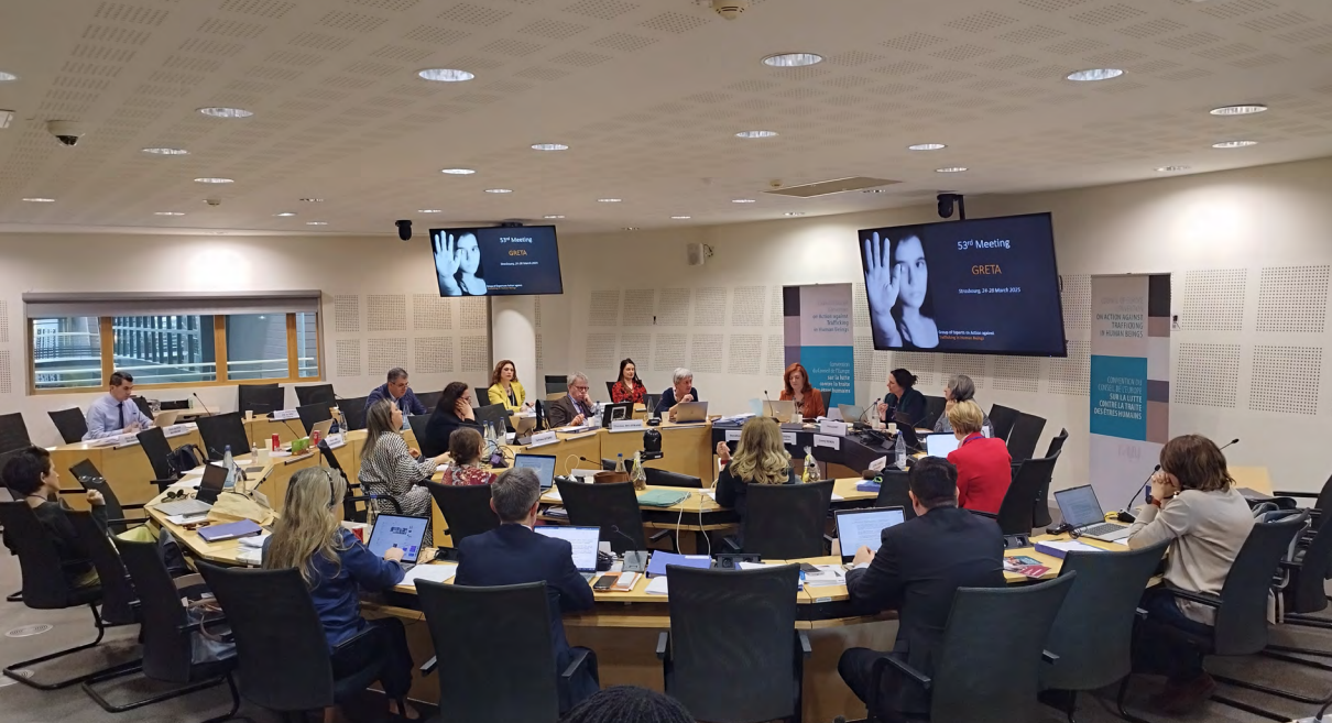
53 e réunion du GRETA, Strasbourg, France, 24-28 mars 2025