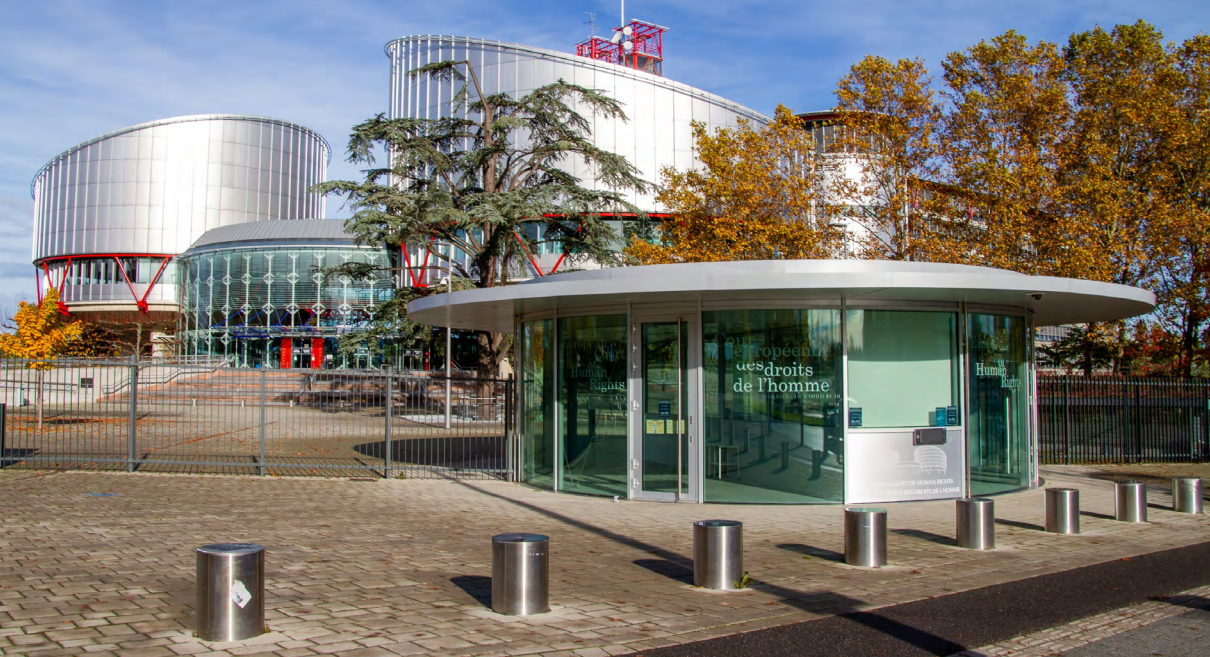
Palais des droits de l'homme, Strasbourg, France