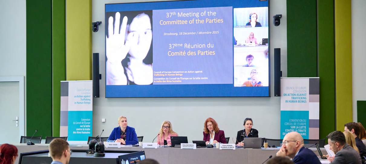
37 e réunion du Comité des Parties, Strasbourg, 18 décembre 2025