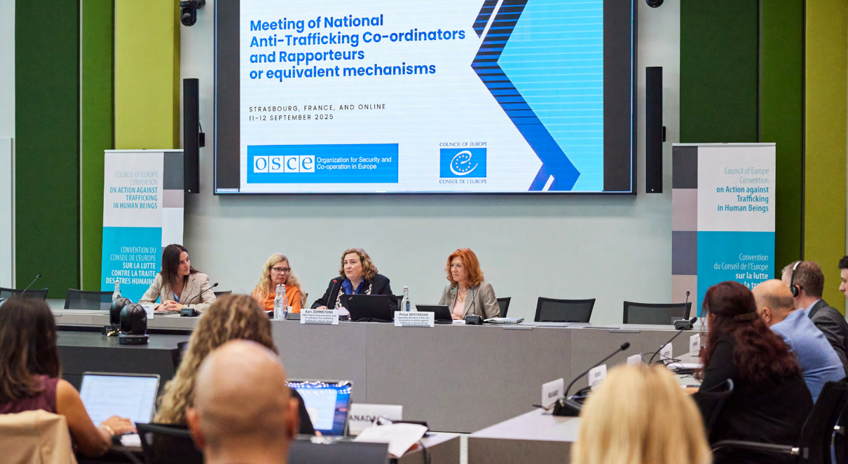
Meeting of National Anti-Trafficking Co-ordinators and Rapporteurs, Strasbourg, 11-12 September 2025