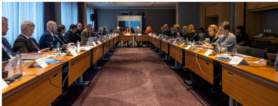
Table ronde sur le suivi du troisième rapport d'évaluation du GRETA sur la Pologne, 28 février 2025

38. Afin de promouvoir une meilleure compréhension des dispositions de la Convention et des recommandations du GRETA, de stimuler le dialogue entre les acteurs concernés et de recenser les domaines dans lesquels le Conseil de l'Europe peut soutenir les efforts nationaux de lutte contre la traite, huit tables rondes ont été organisées en 2025, par ordre chronologique, respectivement: en Pologne (28 février), en Macédoine du Nord (2 avril), en Serbie (10 avril), en Azerbaïdjan (24 avril), aux Pays-Bas (8 juillet), en Suède (9 septembre), en Islande (30 septembre), et en Hongrie (13 novembre).