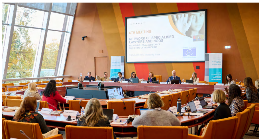
Sixième réunion du réseau des avocats et des ONG spécialisés dans l'assistance juridique aux victimes de la traite des êtres humains, Strasbourg, 3-4 novembre 2025

39. Une réunion du réseau des avocats et des ONG spécialisés dans l'assistance juridique aux victimes de la traite s'est tenue à Strasbourg les 3 et 4 novembre 2025. Les participant-es ont discuté de l'application de l'article 14 (permis de séjour) de la Convention du Conseil de l'Europe sur la lutte contre la traite des êtres humains, des problèmes posés par la qualification erronée des cas de traite des êtres humains, de l'utilisation de renseignements en source ouverte lors des enquêtes pour soutenir la pratique juridique, ainsi que des moyens de renforcer le rôle du secteur privé dans la prévention et la lutte contre la traite. Par ailleurs, le 13 mars 2025, un webinaire a été organisé à l'intention du réseau pour présenter l'évolution récente de la jurisprudence de la Cour européenne des droits de l'homme sur la traite des êtres humains.