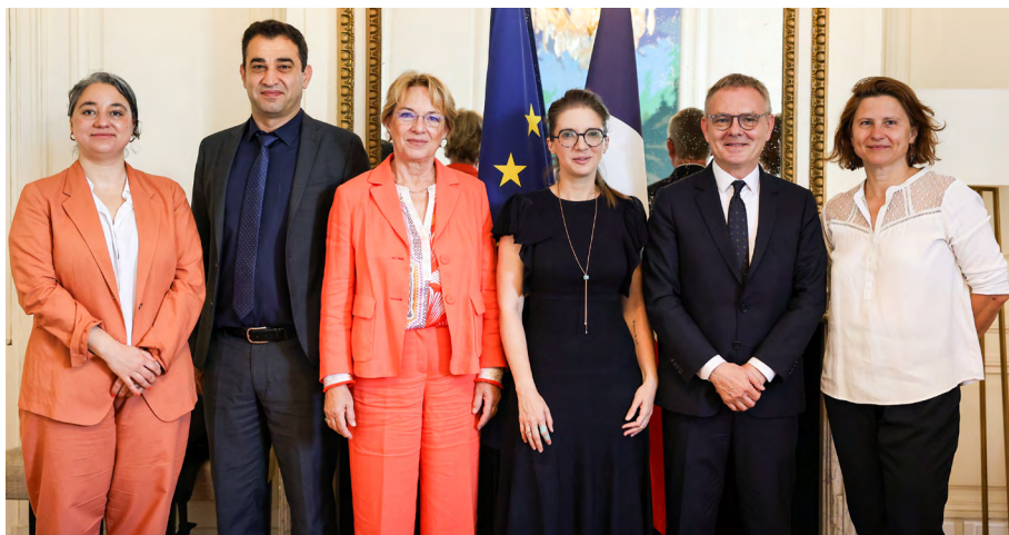
Quatrième visite d'évaluation du GRETA en France, 16-25 juin 2025 – Rencontre avec la ministre chargée de l'Égalité entre les femmes et les hommes et la secrétaire générale de la Mission interministérielle pour la protection des femmes contre les violences et la lutte contre la traite des êtres humains (MIPROF)