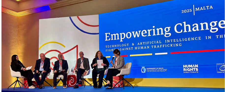
Conférence de haut niveau « Favoriser le changement : la technologie et l'intelligence artificielle dans la lutte contre la traite des êtres humains », Rabat, Malte, 11 juin 2025