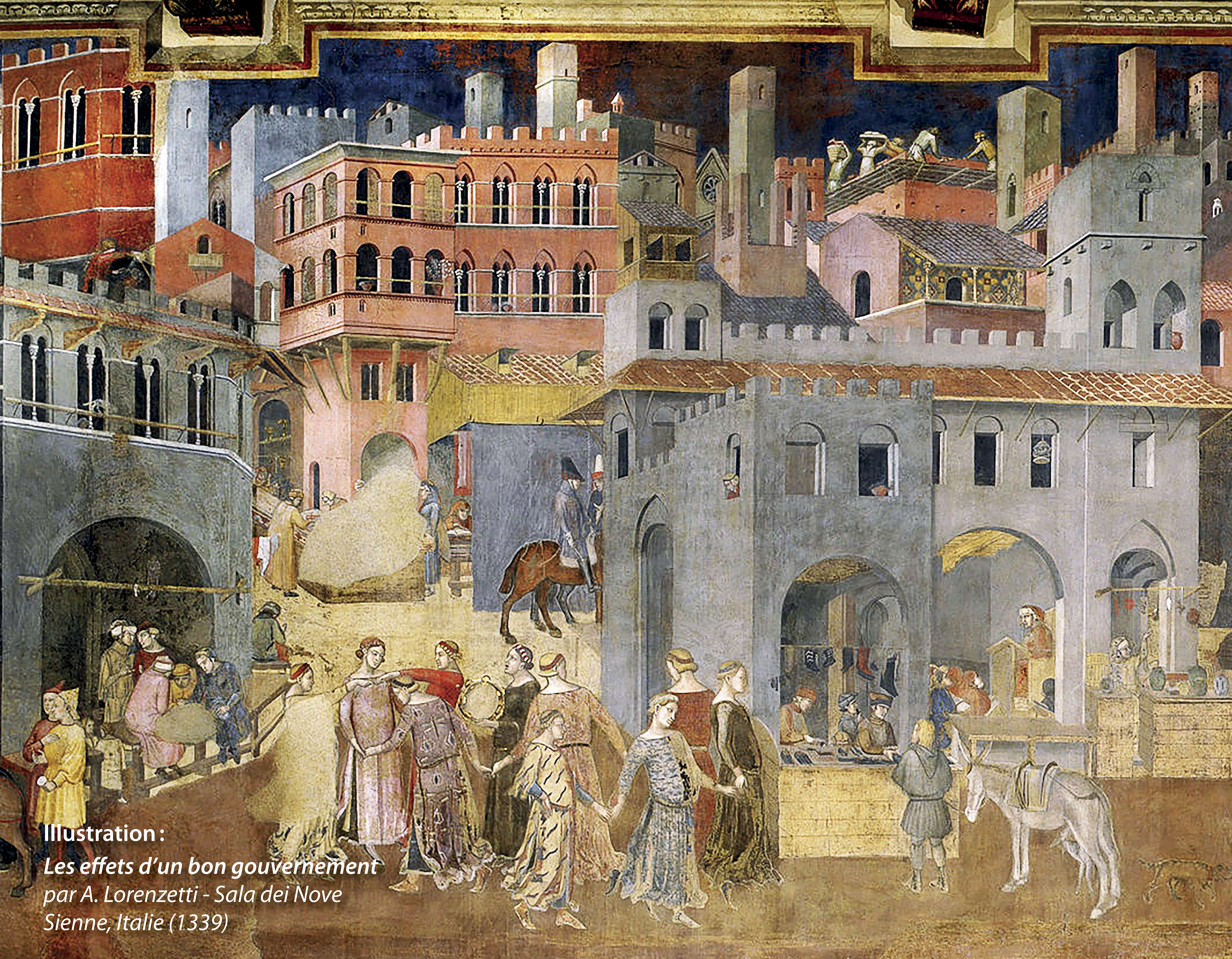
Illustration : Les effets d'un bon gouvernement par A. Lorenzetti - Sala dei Nove Sienne, Italie (1339)