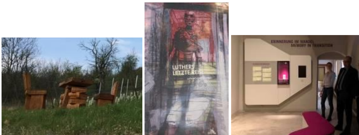
Image 3: Sculptures en bois sur le sentier Luther / Affiche de l'exposition sur les arts textiles et conception de l'exposition dans la maison mortuaire de Luther (Eisleben, Allemagne)

La fondation coopère également avec des universités et des instituts, par exemple l'Institut des arts textiles, pour réinterpréter la vie du réformateur Martin Luther. Des expositions de ces arts textiles sont présentées dans la maison mortuaire de Martin Luther.