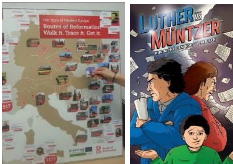
Image 2: tableau de la Réforme / Bande dessinée « Luther vs. Müntzer »

Les membres de l'itinéraire ont l'intention de postuler pour un projet Erasmus+ visant à renforcer davantage les activités d'échanges éducatifs transnationaux, tels que les voyages et les échanges scolaires au niveau européen et les camps d'été internationaux. Ainsi, des projets pilotes avec plusieurs pays participants pourraient être lancés et des expériences personnelles et réelles pourraient être créées grâce à l'utilisation de lieux et de contacts.