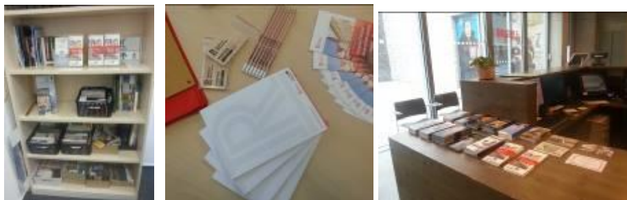
Image 4: Bibliothèque sur la Réforme au quartier Général / Marchandise / brochures sur le comptoir de la maison mortuaire de Martin Luther