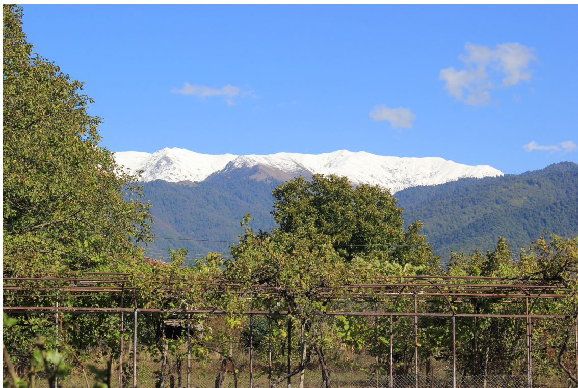
პანკისის ხეობა

ბირკიანშიც დამკვიდრდნენ. ომალოს, ჯოყოლოსა და ბირკიანის მაცხოვრებლები 1960 წლამდე (სხვა მონაცემებით, II მსოფლიო ომამდე) ქრისტიანები იყვნენ. ჯოყოლოსა და ომალოში ისლამის რევიტალიზაცია 70-იან წლებში დაიწყო.