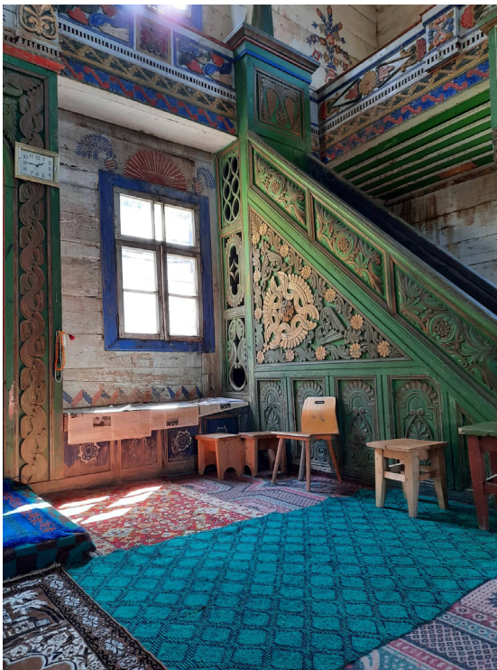
სოფელ დღვანის ჯამე

ჯამე - აჭარაში მეჩეთს ჯამეს უწოდებენ. ჯამე დიდ, საკრებულო მეჩეთს ნიშნავს. 21 აჭარული მეჩეთები ადგილობრივი და ისლამური ხელოვნების ტრადიციების შერწყმის ნიმუშია. აქ შემორჩენილი ძველი ხის ჯამეები აგებულია XIX საუკუნეში, მათი ნაწილი აშენდა ოსმალეთის იმპერიის მმართველობისას, ნაწილი - რუსეთის იმპერიისას. არქიტექტურა და ორნამენტების სტილი იცვლება პოლიტიკურ-კულტურული დომინაციის ცვლილების ფონზე. საბჭოთა პერიოდში მეჩეთები სასოფლო-სამეურნეო დანიშნულებისთვის გადაკეთდა. ხულოს, შუახევის და ქედის რაიონის მთიან სოფლებში ისინი უფრო შენარჩუნდა, ფიზიკურად ან ნაწილობრივ განადგურდა ხელვაჩაურის, ქობულეთის რაიონების მეჩეთები. აჭარის ხის ჯამეები უნიკალური ხით ხუროთმოძღვრების ნიმუშებია. თითოეული ჯამე გამოირჩევა ხის ჩუქურთმებითა და კედელზე მოხატული ორნამენტებით. აჭარის ხის ჯამეები სრულყოფილად არ არის შესწავლილი. მათი სამომავლო კვლევა ქართულ-ისლამური კულტურული მემკვიდრეობის ახალ ნიმუშებს აღმოაჩენს. დღეს აჭარაში ეროვნული მნიშვნელობის კულტურის ძეგლის კატეგორია აქვს მინიჭებული ქედის რაიონში სოფელ ახოს ჯამეს (2006) 22 და სოფელ გეგელიძეების ჯამეს (2009), ქობულეთის მუნიციპალიტეტში კვირიკეს ჯამეს (2006), ხულოს მუნიციპალიტეტში ბელეთის და დიდაჭარის ჯამეებს (2006), ასევე, ხულოს რაიონში ღორჭომის ჯამეს (2018).