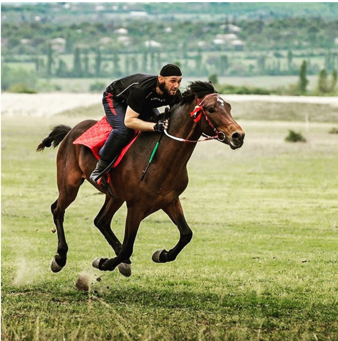
დოლი პანკისში

დოლი - ქისტებში თითქმის ყველა დღესასწაულს ახლავს დოლი. მას ზოგიერთ შემთხვევაში რელიგიური და რიტუალური მნიშვნელობაც აქვს, მაგალითად, როცა მიცვალებულის სულის მოსახსენებლად იმართება. მსგავსი ტრადიცია არსებობდა ხევსურეთსა და თუშეთშიც. ქისტები დოლს მართავენ გარდაცვლილის პატივის მისაგებად, თუ ის თავის სიცოცხლეში გამოირჩეოდა. ძველი ტრადიციით, დასაფლავების დღეს ქირისუფალი საფლავზე ალამს ჩაასობდა იმის ნიშნად, რომ ოჯახი მიცვალებულს „დოლს გადაუხდოდა“. ეს იყო და არის დიდი რიტუალი, სადაც მონაწილეებსა და სტუმრებს უმასპინძლდებიან. დოლი ფინანსური ხარჯის განვესაც ნიშნავს. ყველა მონაწილე საჩუქრდება. ქისტები ცხენოსნობის დიდი სიყვარულით გამოირჩევიან და ეს დღესაც აისახება მათ ყოველდღიურობასა და კულტურაში.