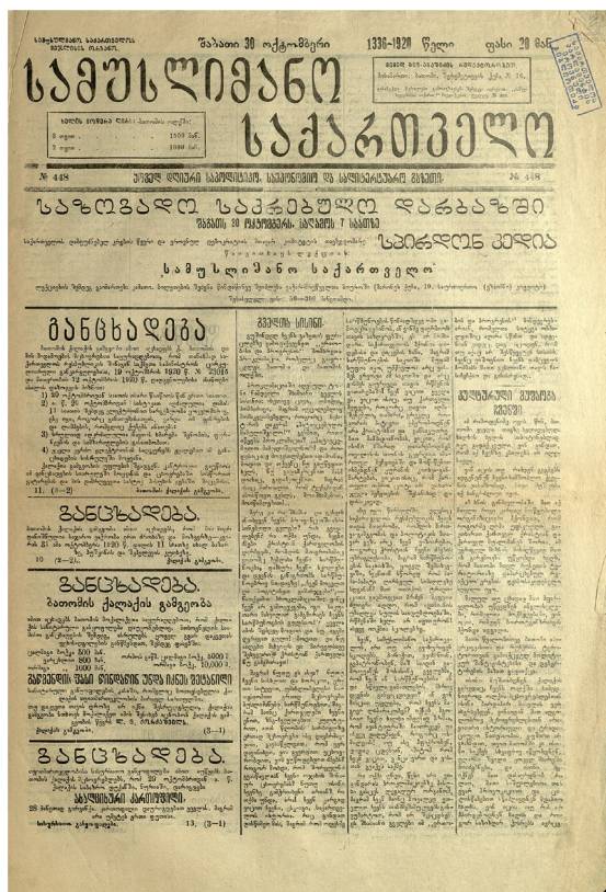
გაზეთი „სამუსლიმანო საქართველო“, 1920 N448

1918-1920 წლებში ბათუმი ჯერ თურქების, შემდეგ ინგლისელების მიერ იყო ოკუპირებული. ბათუმი რამდენიმე ქვეყნის ინტერესების ეპიცენტრში მოექცა: ბრიტანელებს სურდათ ქალაქს თავისუფალი პორტის სტატუსი ჰქონოდა, როგორც ტრიესტს; ქელამალისტური თურქეთი ბათუმის დაბრუნებას განიზრახავდა; ბოლშევიკებს სურდათ აქედან როგორც ინგლისელების, ასევე ქართველი მენშევიკების განდევნა; ბაქოს, როგორც ნავთობის მომპოვებელ მხარეს, საპორტო ქალაქში ეკონომიკური ინტერესები ჰქონდა. აჭარაში ამ დროს გაიმარჯვა პროქართულმა ორიენტაციამ, „გაერთიანებული მუსლიმთა საბჭო“ მისალმა საქართველოს რესპუბლიკის ჯარების შესვლას ბათუმში. 1920 წლის ივლისში საქართველოს ჯარებმა ბათუმის ოლქი დაიკავეს. ინგლისის ჯარმა ბათუმი დატოვა.