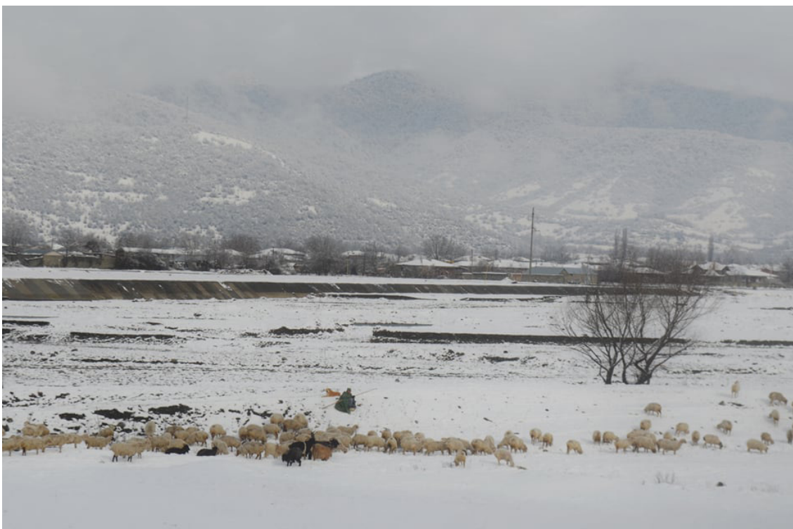
პანკისის ხეობა

დღეს პანკისში ქისტებისთვის ყველაზე მნიშვნელოვანია, ხეობისა და თემის დაცვა სახელის დისკრედიტაციისგან. ბოლო პერიოდში ხეობაში აქტუალურია ეკოლოგიისა და ეკონომიკის საკითხი, რომელიც ამავედროულად პოლიტიკური საკითხიცაა. ქისტები ეწინააღმდეგებიან სოფელ ბირკიანში ჰესების მშენებლობას. მათი აზრით, ეს გამოიწვევს ხეობის ეკოსისტემის ნეგატიურ ცვლილებას, ისედაც მცირემინიანი მოსახლეობა დაკარგავს საძოვრებს, წყალს და ტურიზმის პოტენციალს.