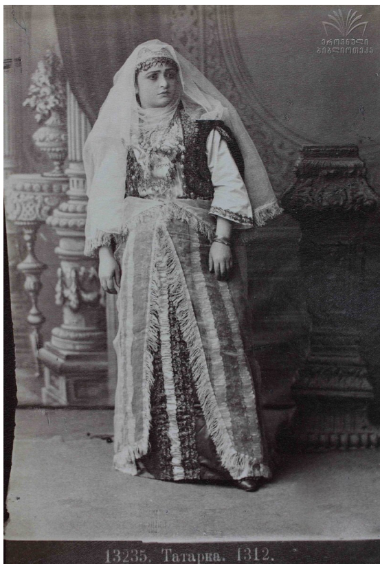
“თათახი გოგო”

1801 წელს, იმპერატორის ბრძანებით, ქართლ-კახეთის სამეფო გაუქმდა და რუსეთის იმპერიის შემადგენლობაში შევიდა. შედეგად, ბორჩალოს მხარეში ინერგება რუსული ადმინისტრაცია. ამავე პერიოდში რეგიონში არსდება რამდენიმე გერმანული კოლონია. რუსეთ-თურქეთის ომის შემდეგ ბორჩალოს მხარეში სახლდებიან ეთნიკური ბერძნებიც. მაზრა მეტად მრავალეთნიკური გახდა. 1880 წელს ამ ტერიტორიაზე შეიქმნა ბორჩალოს მაზრა (ცენტრით დაბა შულავერში), რომელიც მოიცავდა დღევანდელი წალკის, მანგლისის, თეთრიწყაროს, დმანისის, ბოლნისის, მარნეულის ტერიტორიას.