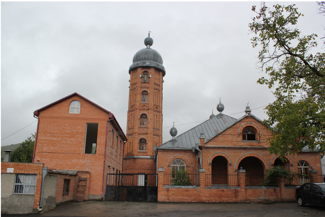
სოფელ დუისის მეჩეთი

ქისტების უმრავლესობა მშვიდ, პასიურ რელიგიურ ჯგუფს მიეკუთვნება, რომელსაც არ აქვს პოლიტიკური მიზნები. მათთვის მნიშვნელოვანია წმინდად დაიცვან რელიგიური ცხოვრება. დღევანდელ დღეს რელიგიურ ლიდერებს ხეობაში აქვთ რელიგიური ცოდნის, „საზოგადოებაში სწორი ღირებულების“ დამკვიდრების პრეტენზია. ახალი მეჩეთი ხეობაში ერთდროულად რელიგიური და სოციალური ცენტრია. რელიგიური ლიდერები თავიანთ ქადაგებებსა და განცხადებებში ყურადღებას ამახვილებენ იმაზე, თუ რა სოციალური ზეგავლენა მოახდინა ისლამმა (სალაფიზმმა) ხეობაში, კერძოდ, ნარკომანიის, ქურდობის და, ზოგადად, კრიმინალის შემცირებაზე.