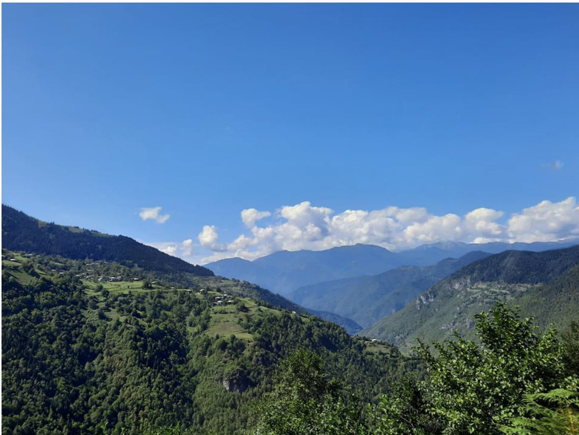
ზემო აჭარა

მემთეურობა და შუამთობა - აჭარის ადმინისტრაციული ერთეულები - ქედა, შუახევი და ხულო - მთიან რეგიონს მიეკუთვნება. ადგილობრივები ქედას ქვემო აჭარას აკუთვნებენ, შუახევსა და ხულოს - ზემო აჭარას. ზემო აჭარას ზეგნებსაც უწოდებენ. აჭარის ყოფისთვის დამახასიათებელია მემთეურობის ტრადიცია. თითოეულ სოფელს აქვს საზაფხულო სახლი და საძოვრები მთაში, რომელსაც ეწოდება იალადი, ეილაან იაილა. ტრადიციულად, აჭარლები ზაფხულობით მთაში მიდიან, მიჰყავთ საქონელი და მთელ ზაფხულს იქ რჩებიან. ეს მათი ცხოვრების ციკლის ნაწილია დღემდე და მას „მთაში წასვლას“ უწოდებენ. ყველა სოფელს და, შესაბამისად, სოფლის მცხოვრებს თავისი მთა (ეილა) აქვს. დღეს ცნობილი კურორტი ბეშუმი ერთ-ერთი ასეთი საზაფხულო იალადია. მთაში მიდიან განსაკუთრებით მოხუცები და ბავშვები. მთაში ყოფნასთან არის დაკავშირებული სახალხო დღესასწაული შუამთობა, მისი შინაარსი არააჭარელმა შეიძლება არც იცოდეს. შუამთობა მთაში ყოფნის შუა პერიოდს აღნიშნავს. ადრე მის აღნიშვნას უფრო დიდი დატვირთვა ჰქონდა და მემთეურები განსაკუთრებით ელოდებოდნენ. ამ დღეს სოფლიდან ამოდიოდნენ ნათესავები, თანასოფლელები, სტუმრები და ღამისთევით ზეიმობდნენ. ერთი დღით მთის რუტინას არღვევდა მხიარულება, სხვადასხვა თამაშობა, მუსიკა, სტუმრიანობა. შუამთობას აღნიშნავდნენ ყველა მთაზე. დღეს ახალგაზრდები აღარ ატარებენ დიდ დროს მთაში. თუმცა საქონლისა და მეურნეობისთვის ზაფხულის იალალზე გატარების ტრადიცია ზემო აჭარაში მაინც ნარჩუნდება.