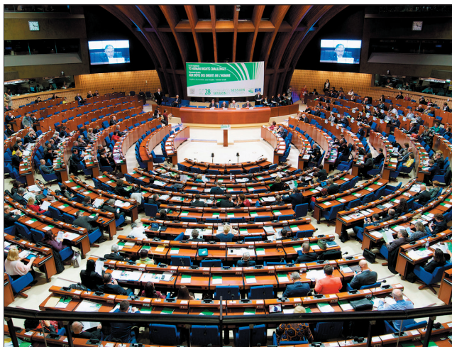
Доклады о мониторинге обсуждаются и принимаются на пленарных сессиях Конгресса.

Административный контроль за деятельностью органов местного самоуправления