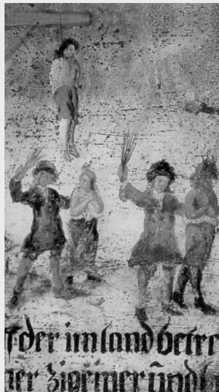
Il. 5 (Detalji) Plakat upozorenja kojim se pretilo Romima, postavljen na granici Svetog rimskog carstva, oko 1715. godine. (iz Asséo, Henriette 1994: Les Tsiganes. Une destinée européenne. Paris: Gallimard, str. 37)