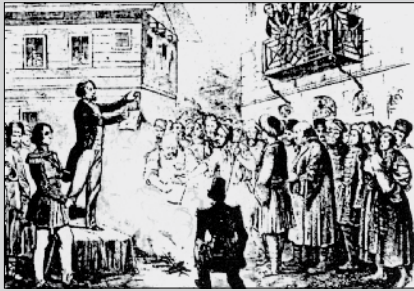
Ilustr.12 Studenti români arzând, în piața publică, vechile legi care autorizau robia la București –25 septembrie 1848