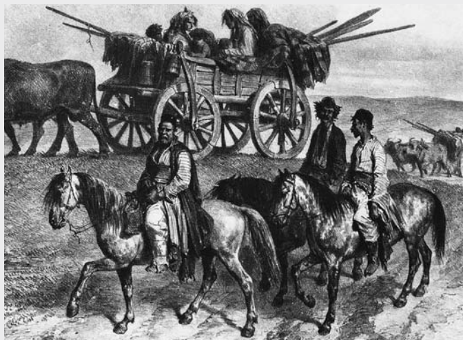
Ill. 3 (katar Hancock 2002, p.28)