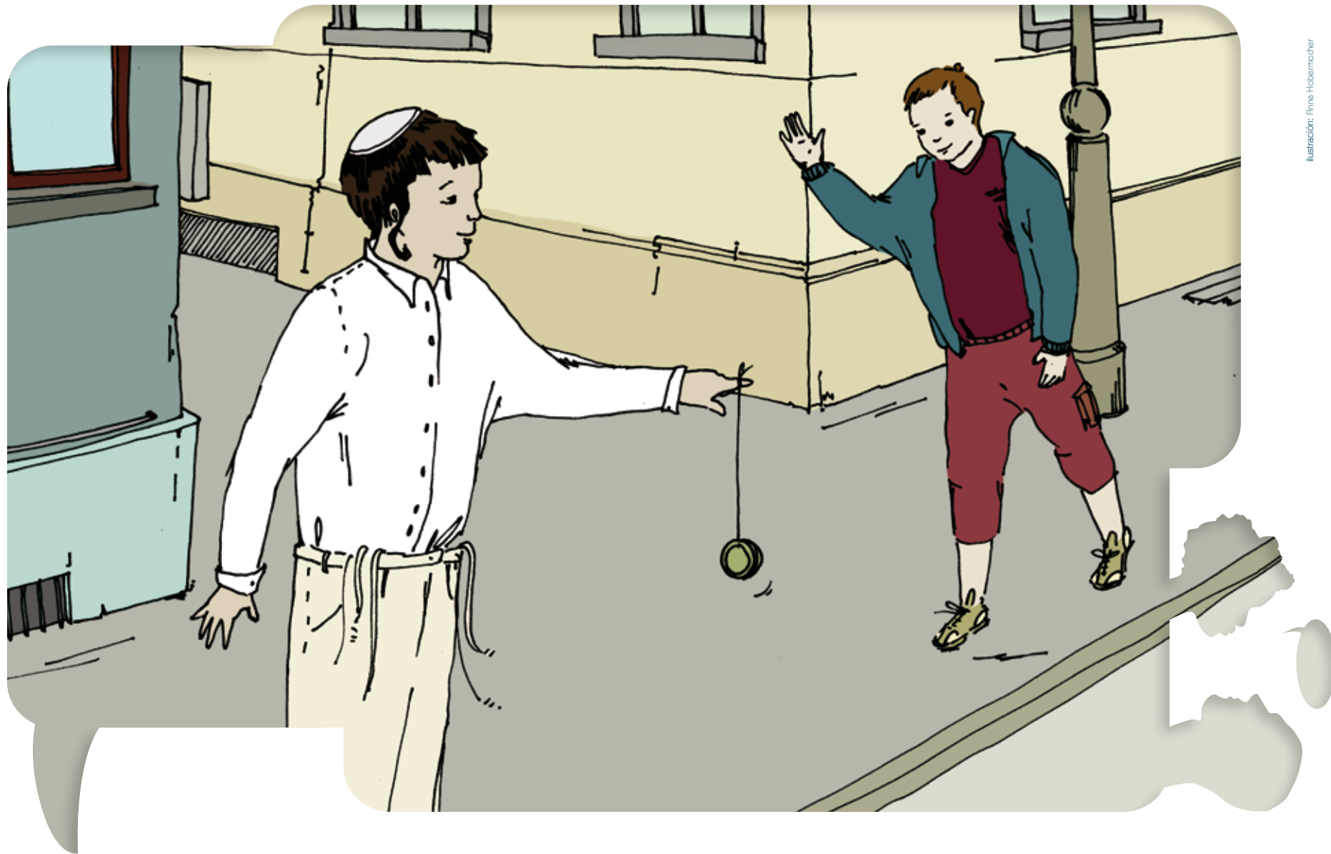
Ilustración: Anne Hobermocher

Autobiografía de Encuentros Interculturales Versión para los alumnos más jóvenes • Tarjetas con ilustraciones