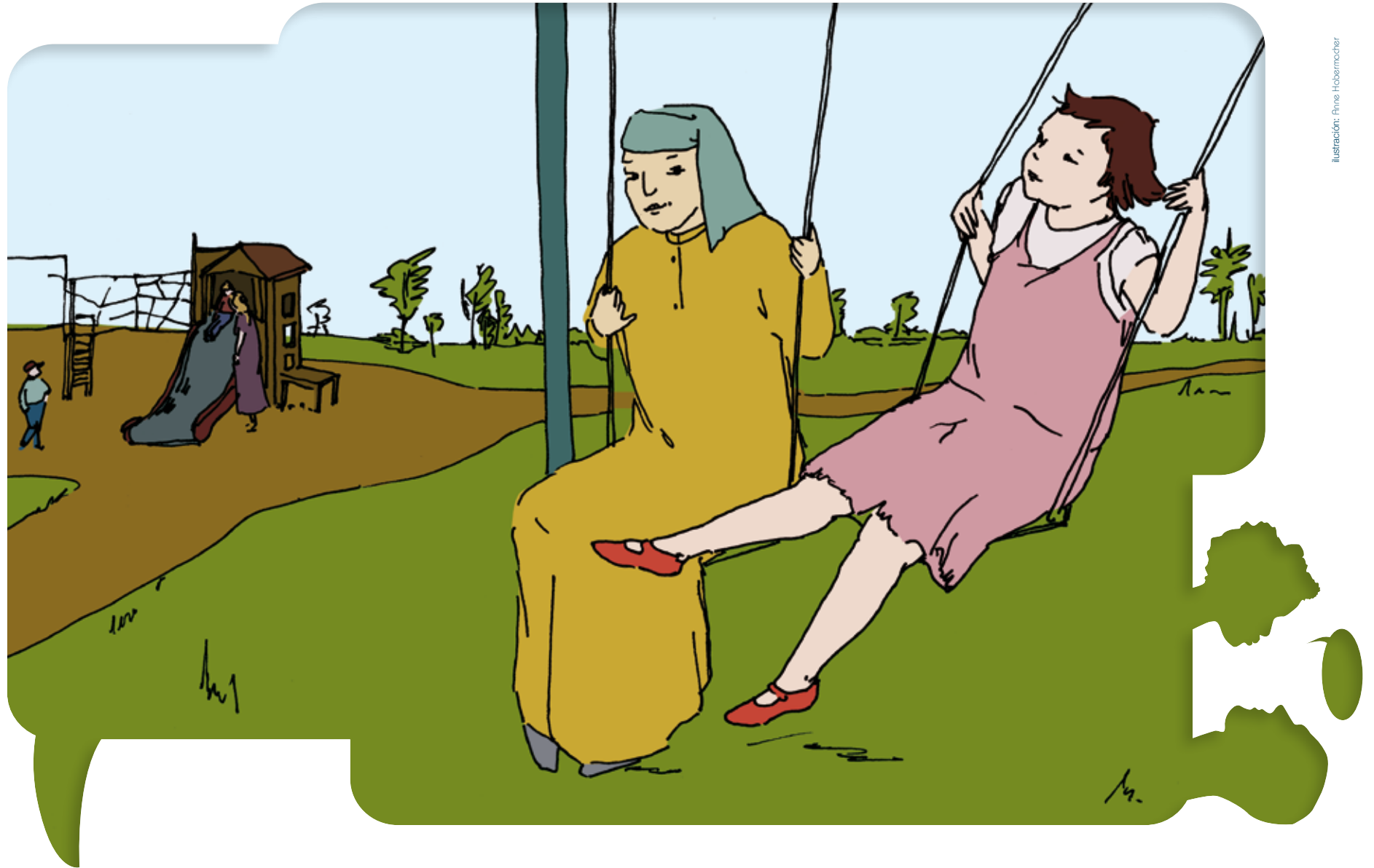
Ilustración: Anne Hobermücher

Autobiografía de Encuentros Interculturales Versión para los alumnos más jóvenes • Tarjetas con ilustraciones