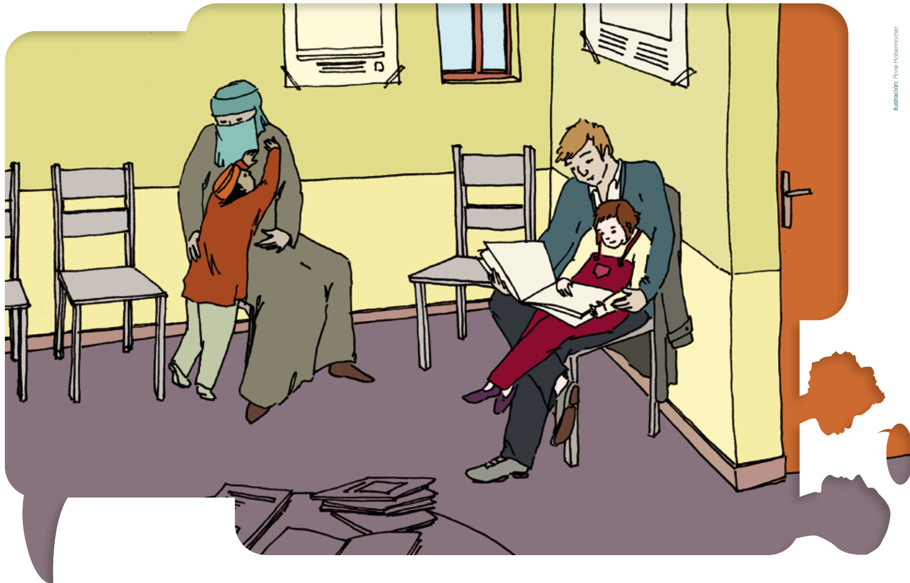
Ilustración: Anne Hobermücher

Autobiografía de Encuentros Interculturales Versión para los alumnos más jóvenes • Tarjetas con ilustraciones