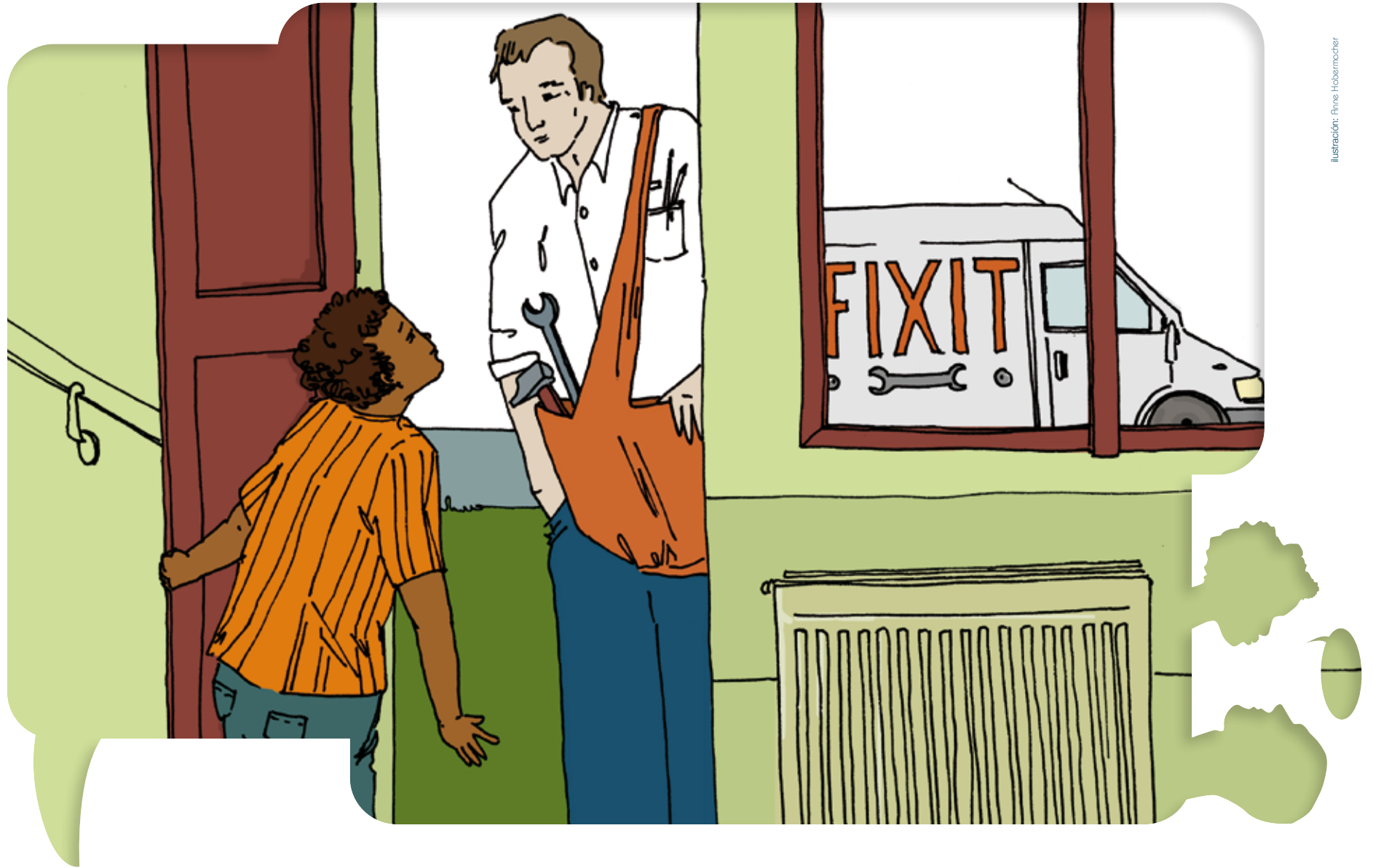
Ilustración: Anne Hobermücher

Autobiografía de Encuentros Interculturales Versión para los alumnos más jóvenes • Tarjetas con ilustraciones