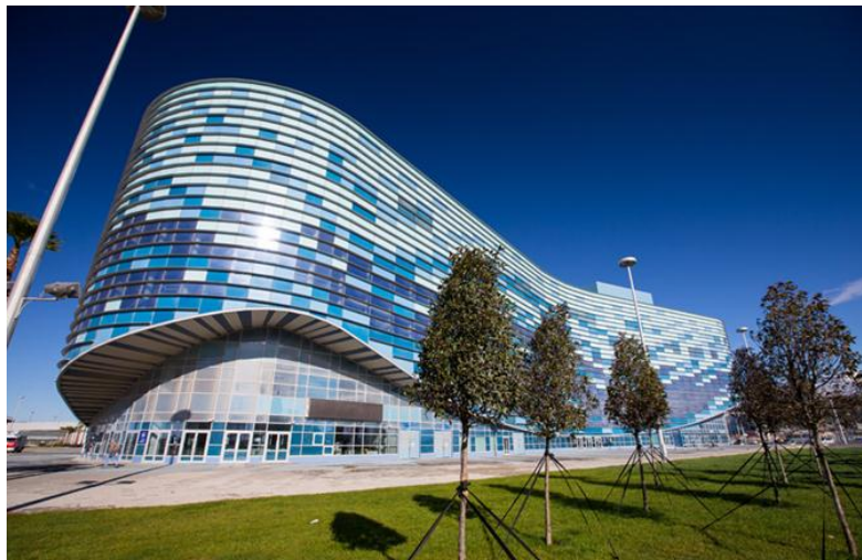
Palais des sports de glace Iceberg, Sochi