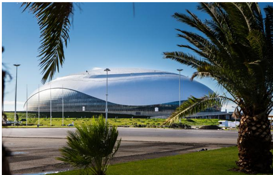
Palais des glaces Bolchoï, Sotchi