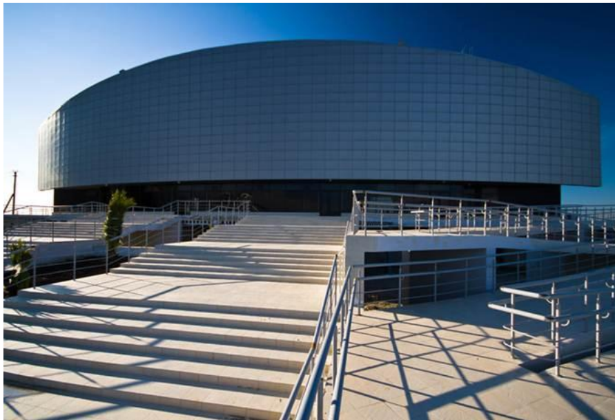
Centre de curling "Ice cube", Sochi

Je tiens à remercier de nouveau, au nom du Conseil de l'Europe, les autorités russes d'avoir accueilli cette manifestation et, en particulier, Monsieur le Ministre Vitaly MUTKO de s'être investi personnellement pour en faire un succès.