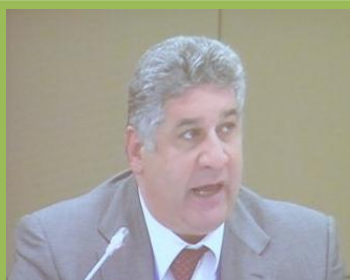
Azad RAHIMOV : « L'organisation des premiers Jeux Olympiques européens, qui se tiendra à Bakou en 2015, permettra de former des milliers de jeunes aux nouvelles technologies de l'information et de la communication. »