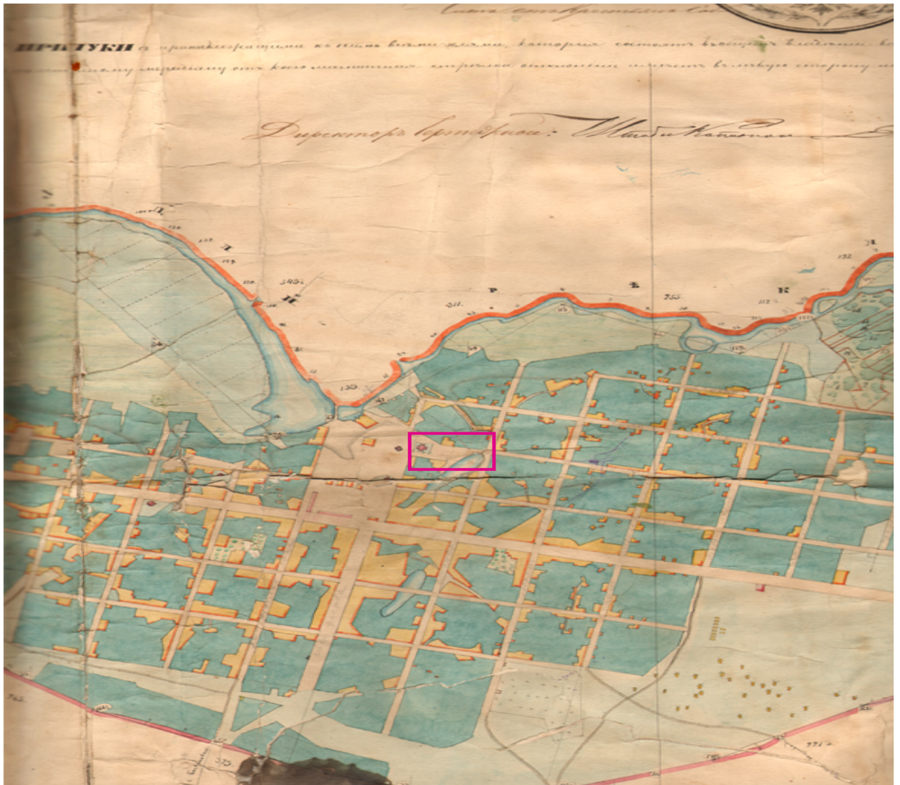
Витяг з генерального плану Прилук, 1781 рік, із покажчиком місця розміщення об'єкту оцінки.