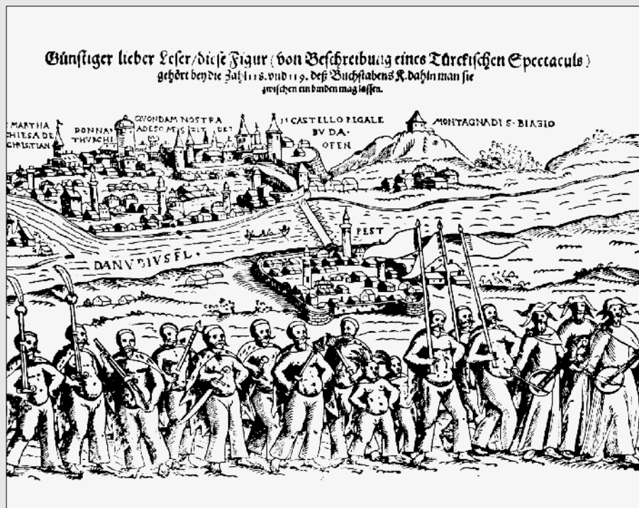
II. 5 Otomanska vojska s (najverovatnije romskim) vojnim muzičarima pred dverima Budima i Pešte. (Marushiakova / Popov 2001, str. 21)