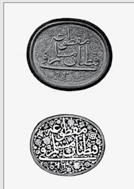
II. 6 Otisak i kalup krv-crvenog pečata Carne- lian Seal, vrsta koju je koristila otomanska vlast za potvrđivanje redovnog plaćanja poreza. (Marushiakova / Popov 2001, str. 40)

neki članovi oporezivane populacije koji su pozivani na ispunjavanje vojne dužnosti, bili muslimani Romi. Pro-