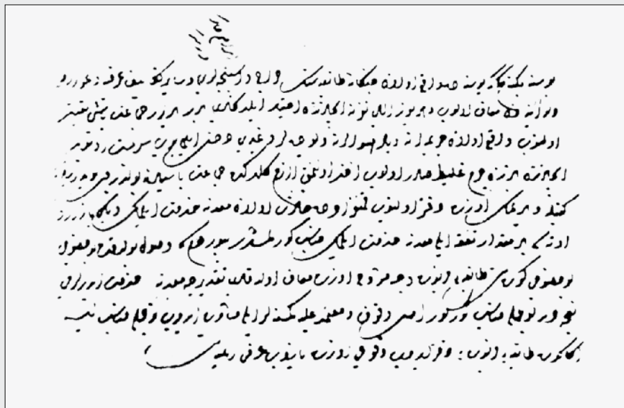
II. 3 Ukaz sultana Selima II iz 1574. godine. (Marushiakova / Popov 2001, str. 33) (Detalj)