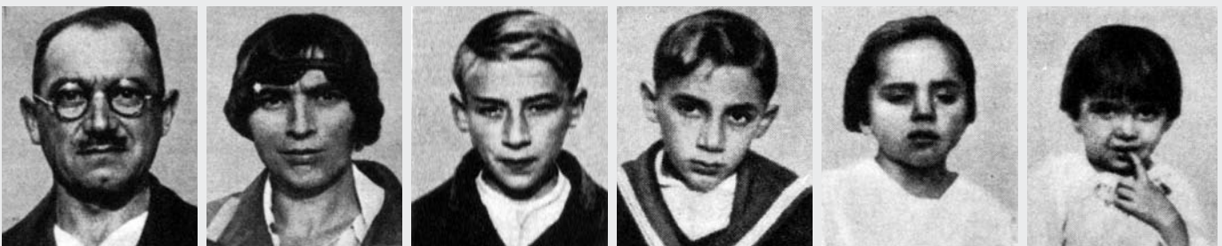
II. 5 Fotografije „ciganske porodice” iz članka Gvida Landre. Fotografije je trebalo da „dokažu inferiornost Cigana”. (Boursier 1999, str. 16)

Mere koje je fašistički režim preduzeo protiv Roma mogu se podeliti u najmanje dve faze. U prvoj fazi, pre septembra 1940. godine, zatvorenici su proterivani iz zemlje i ostavljani na granicama, tako da su se, po pravilu, vraćali skoro odmah, i ovo se stalno ponavljalo. U drugoj fazi, između 1940. i 1943. (još uvek ne znamo dovoljno o periodu posle 1943. godine) politika isel-