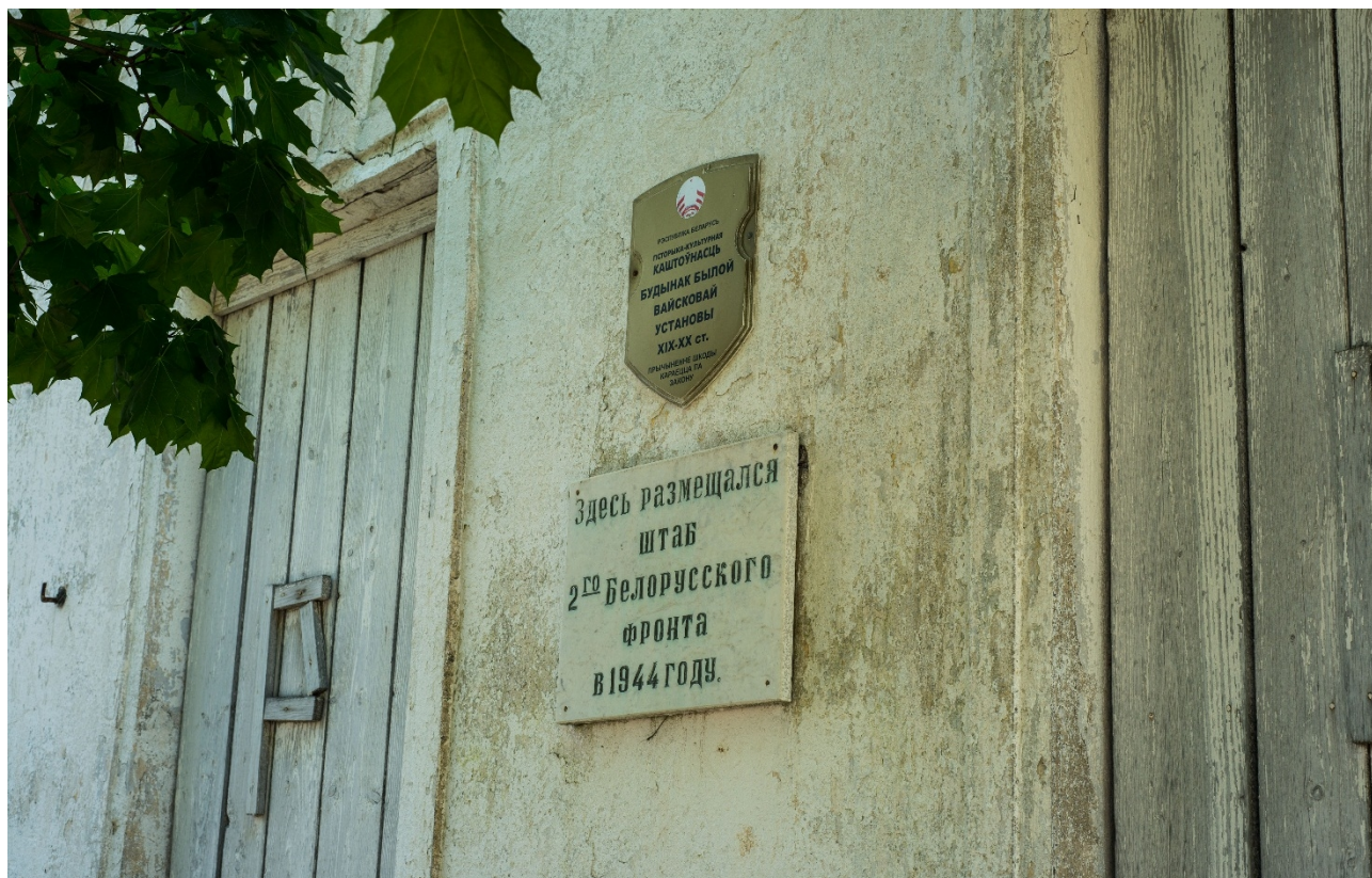
Мсціслаў. Гасцініца «Эрмітаж». Памятная шыльда на будынку