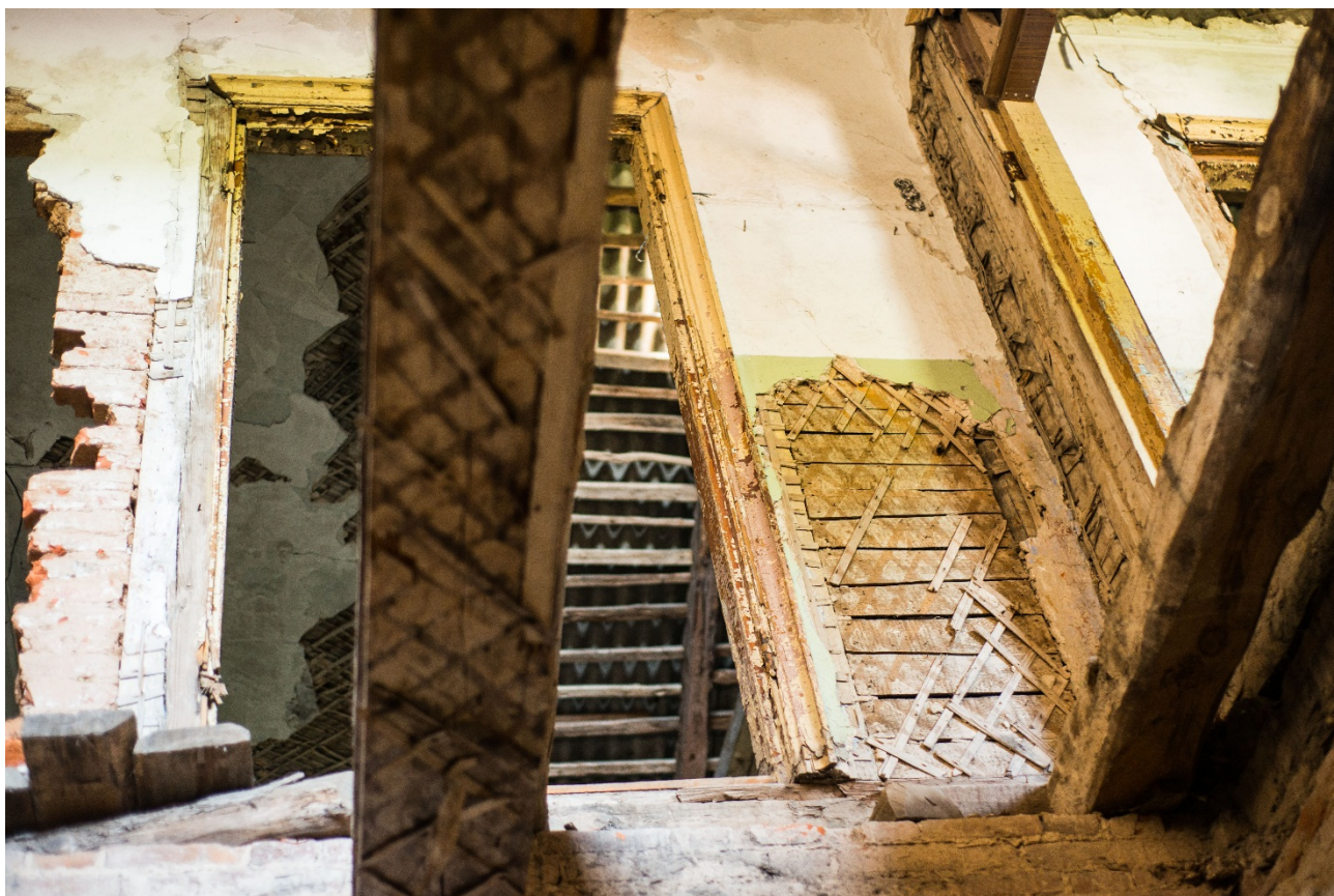
Мсцiслаў. Гасцiнiца «Эрмiтаж»