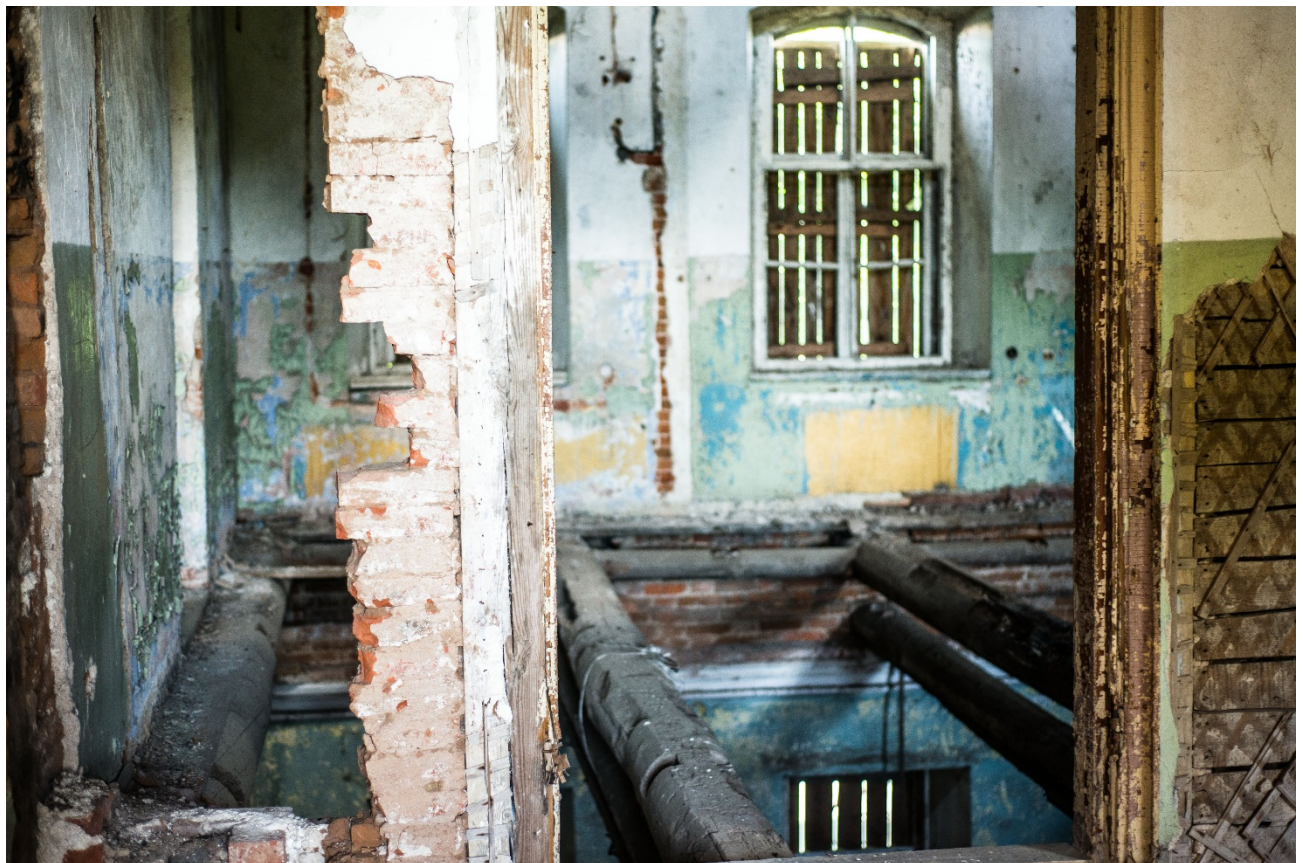
Мсціслаў. Гасцініца «Эрмітаж»