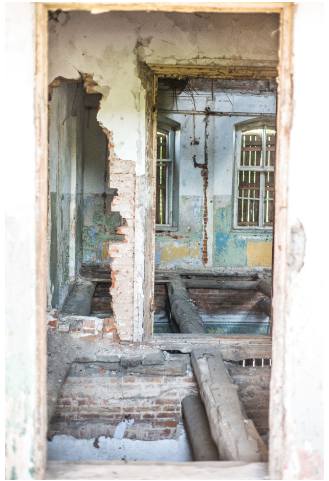
Мсціслаў. Гасцініца «Эрмітаж»