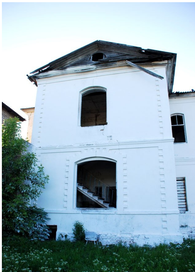
Мсцiслаў. Гасцiнiца «Эрмiтаж». Вiд з унутранай тэрыторыi будынка