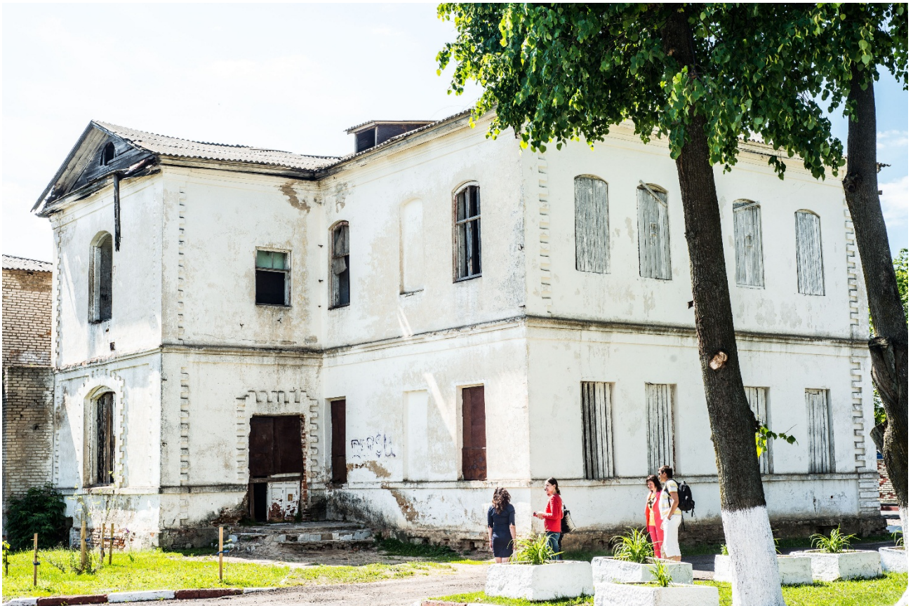
Мсціслаў. Гасцініца «Эрмітаж». Від з унутранай тэрыторыі будынка