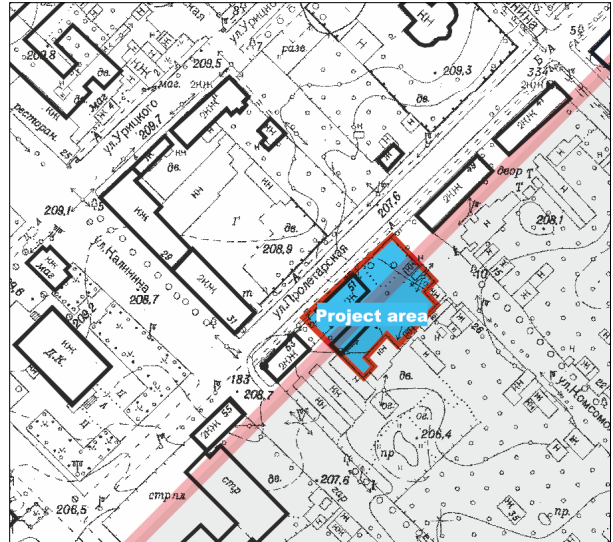
Размяшчэнне на месцы