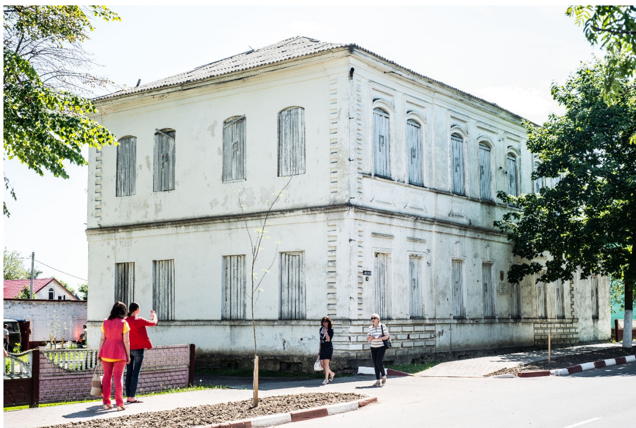
Мсціслаў. Гасцініца «Эрмітаж». Від з вул.Пралетарская