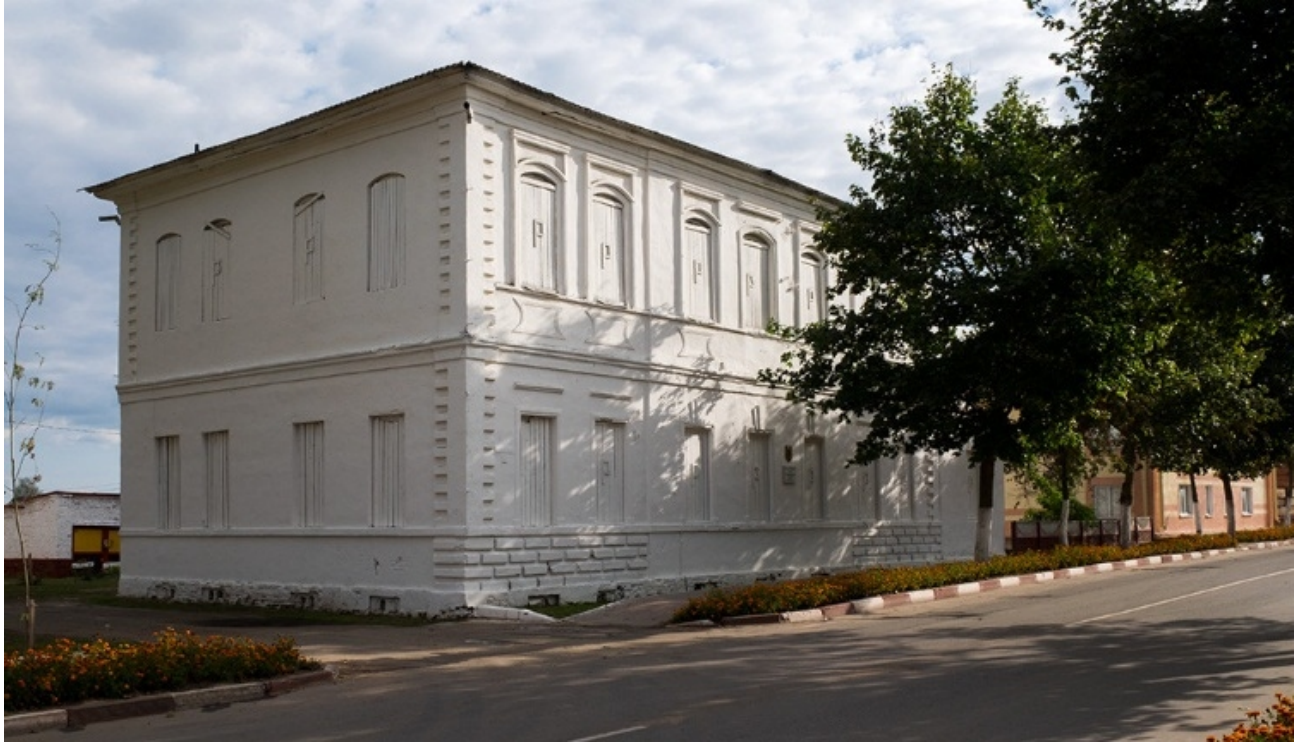
Мсціслаў. Гасцініца «Эрмітаж». Від з вул.Пралетарская