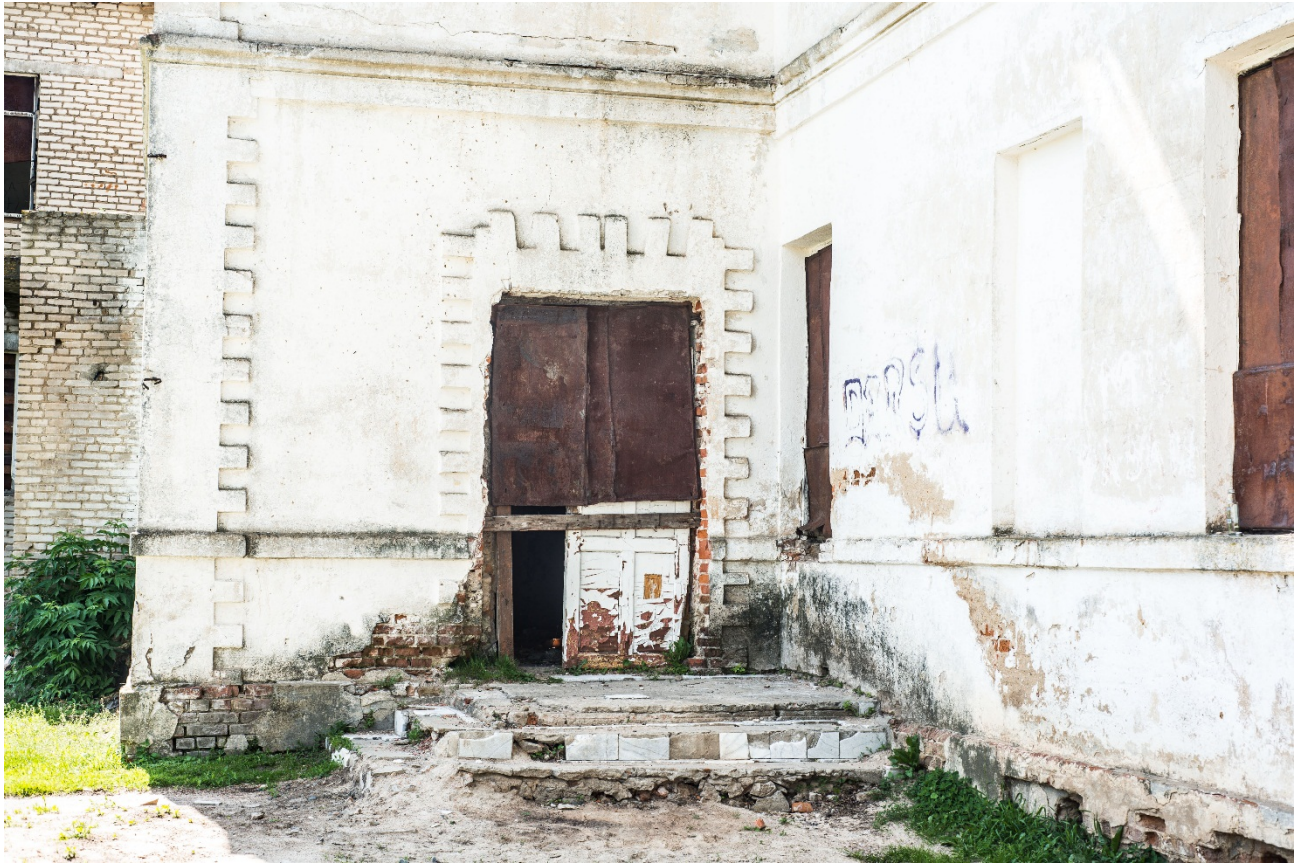
Мсціслаў. Гасцініца «Эрмітаж». Уваход у будынак з унутранай тэрыторыі