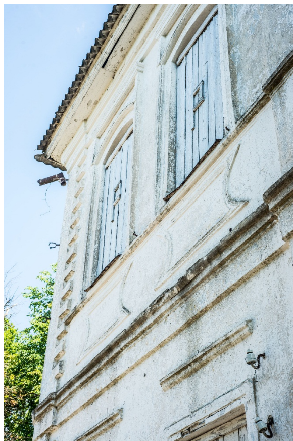
Мсцiслаў. Гасцiнiца «Эрмiтаж». Фрагмент галоўнага фасада будынка