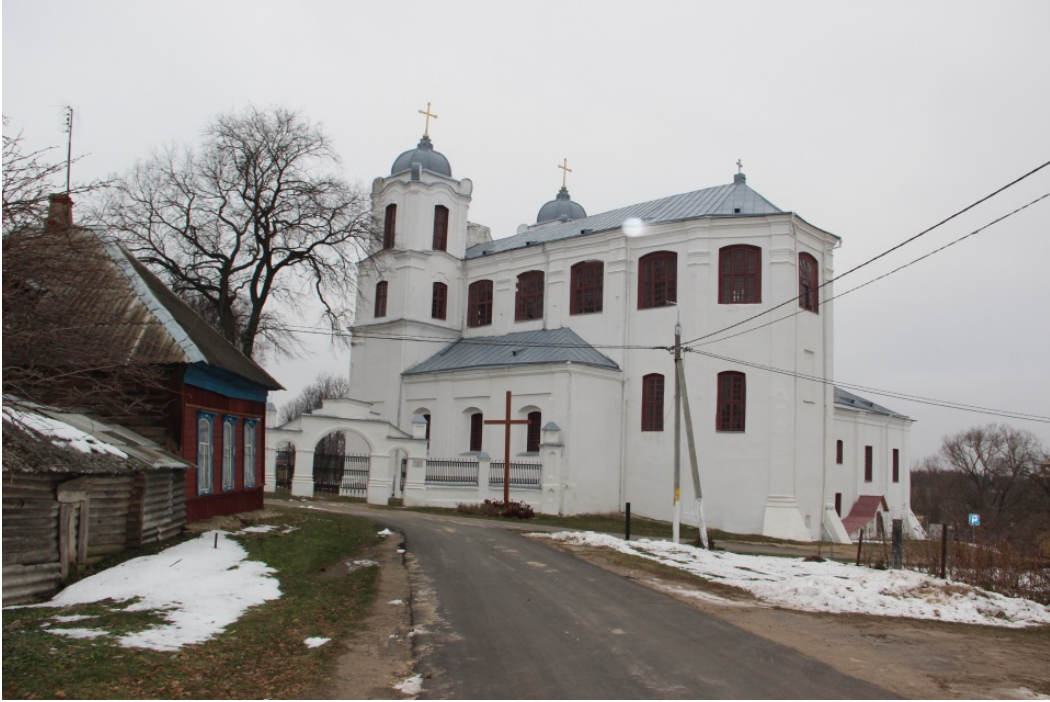
Касцёл кармялітаў. Від на касцёл і ўязную браму з боку вул. Кармяліцкай