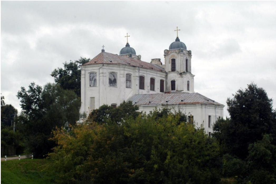
Касцёл кармялітаў. Від на касцёл з Замкавай гары