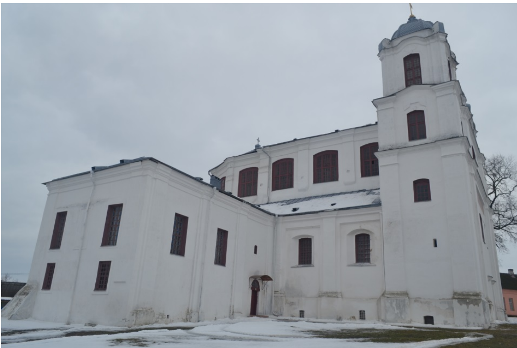
Касцёл кармялітаў. Від на паўночны фасад і 2-х павярховую прыбудову з унутранай тэрыторыі