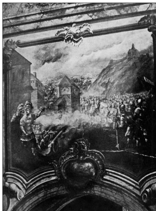
Фрэска "Штурм Мсціслава маскоўскім войскам князя Трубяцкога ў 1654 г.", здымак 1912 г.