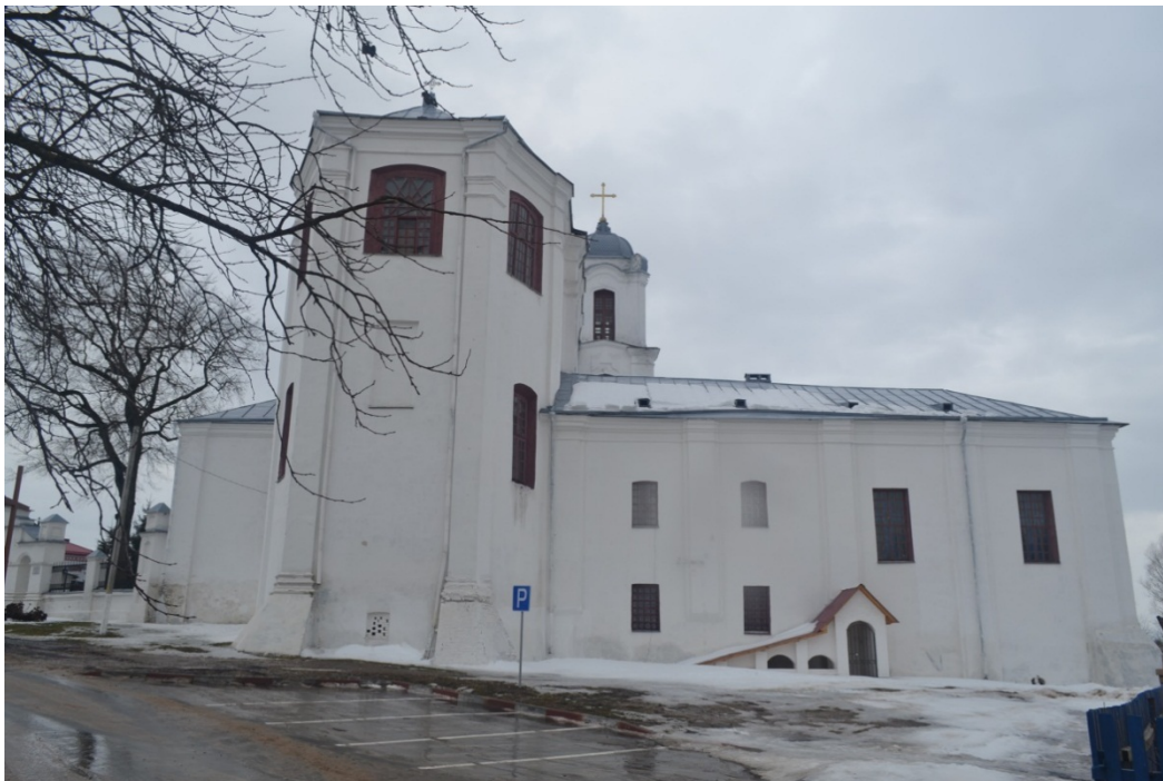
Касцёл кармялітаў. Від на ўсходні фасад касцёла з боку аўтамабільнай паркоўкі