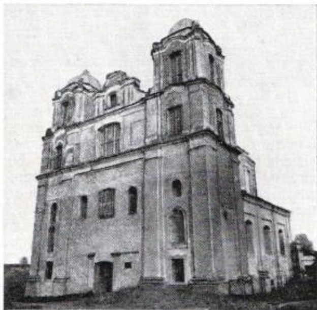
Мсціслаў. Кармяліцкі касцёл Успення Божай Маці

Помнік узгадваецца ў большасці гістарычных даследаванняў аб беларускай архітэктуры і гісторыі горада Мсціслава. Пры падрыхтоўцы гэтага дакладу былі праведзены кансультацыі з адпаведнымі экспертамі: архітэктарамі, гісторыкамі архітэктуры, юрыстамі. Былі выкарыстаныя архіўныя планы, гістарычныя даследаванні, публікацыі, у тым ліку інтэрнэт-выданні.