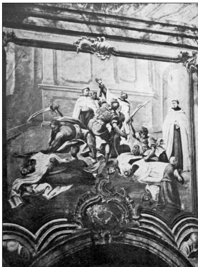
Фрэска «Забойства кармяліцкіх манахаў («Трубяцкая разня»), здымак 1912 г.