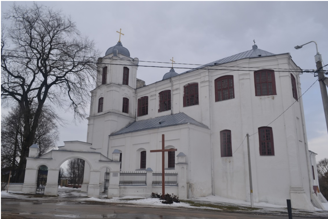
Касцёл кармялітаў. Від на паўднёвы фасад касцёла і ўязную браму з вул. Кірава