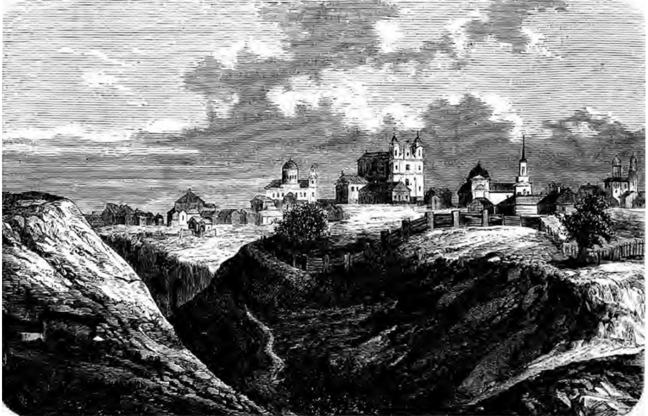
Мсціслаў. Гравюра сярэдзіны 19-га стагоддзя.