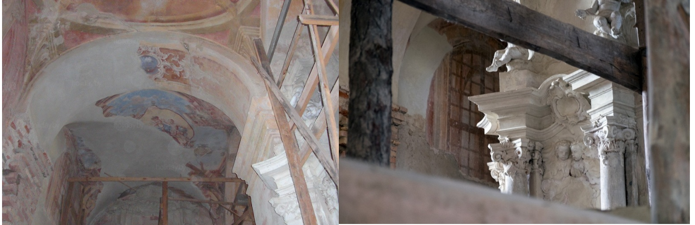
Фрагменты інтэр'ера касцёла кармялітаў