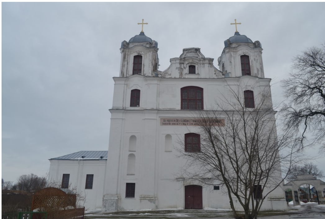
Касцёл кармялітаў. Від на заходні фасад касцёла