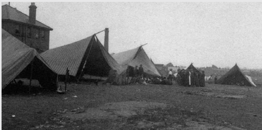
III. 6 Tendat e Kalderashve në Garratt Lane, Wandsworth, Londër në gusht 1911. (Fraser 1992, f. 231)