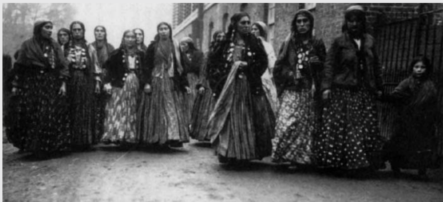
III. 3 Gratë Kalderash në marshin për Angli, 1911.