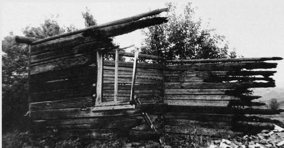
Ill. 6 (katar Haller 1998, p.38)

Jekh romano kher andar Plăieșii de Sus, xarni vramapalal o astaripen le čhingarako andar juno 1991.