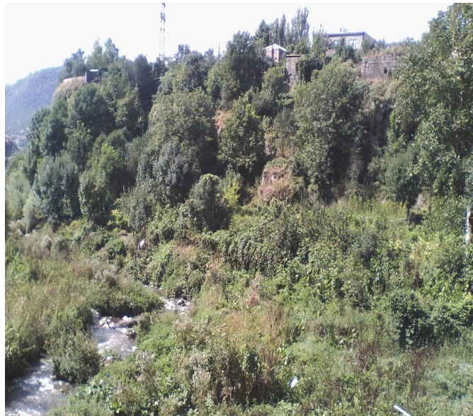
Նկ.8. Տարածքի ընդհանուր տեսքը Վարարակն գետի աջ ափին