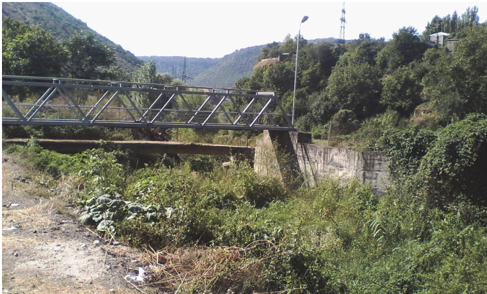
Նկ.12. Տարածքը Գորիս գյուղին կապող հետիոտն կամուրջի տեսքը