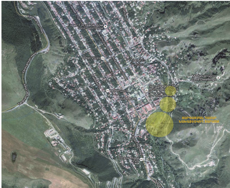
Նկ 9. Տարածքի ընդհանուր տեսքը և դիրքը արբանյակային լուսանկարով