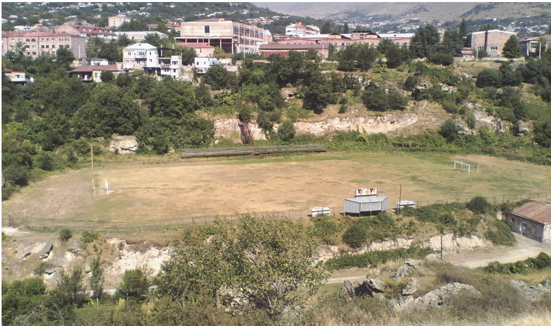
Նկ.3. Գոյություն ունեցող ֆուտբոլի դաշտի տեսքը արևելքից

Քաղաքային տարածքի և մասնավորապես նախատեսվող հողատարածքի համար վտանգ է ներկայացնում «Վարարակն» գետի հեղեղաբերությունը: Գետի սելավաբերության և սելավների դեմ պայքարի համար առաջարկում ենք մեծ ծախսերի հետ չկապված միջոցառումներ, այն է գետահունի ավերի ամրացում քարե շարվածքով, որը հնարավորություն կտա ջրի հոսքի մեղմացմանը: Քարե շարվածքի դեպքում քարը կհանվի գետի հունից՝ մաքրելով նաև գետի ավազանը: