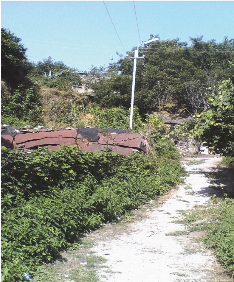
Նկ.13. Տարածքը քաղաքի պատմական կենտրոնին կապող հետիոտն ճանապարհի տեսքը