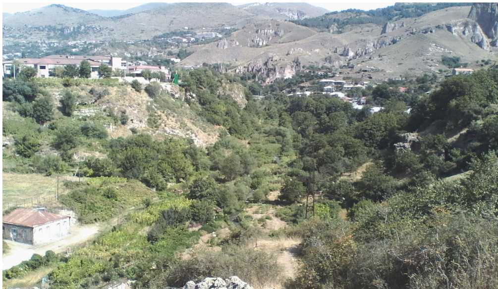
Նկ.14. Տարածքի ներկա վիճակը և Վարարակ գետի դիրքը