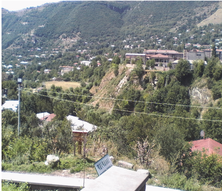
Նկ.7. Տարածքի բնապատկերը Գորիս գյուղ բնակավայրից

Տարածքի անսպառակահարմար և տարերայնորեն օգտագործումը հանգեցրել է վայրի աղտոտվածությանը, թփակավմանը, որը բնապահպանական խնդիրներից բացի առաջացնում է նաև անվտանգության խնդիր: