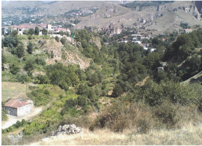
Նկ.1. Դիտակետ. անվանյալ տարածքի ընդհանուր տեսքը արևելքից