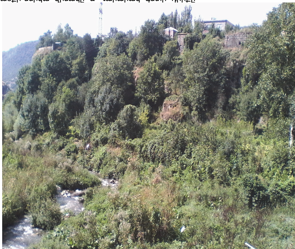
Նկ.15. Տարածքի ներկա վիճակը