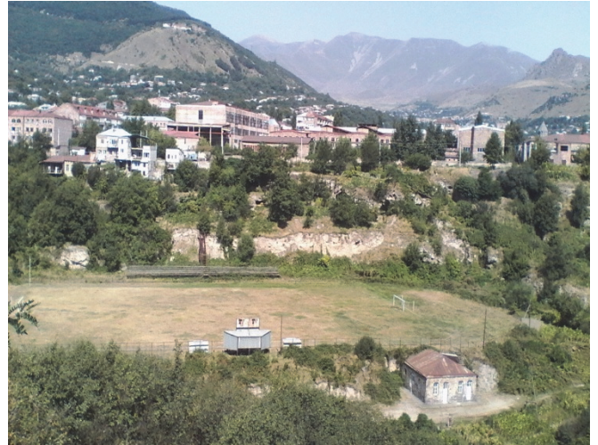
Նկ.2. Գոյություն ունեցող ֆուտբոլի դաշտի տեսքը արևելքից