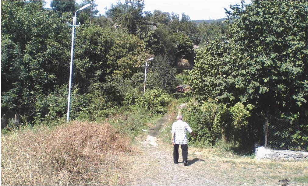
Նկ.11. Տարածքը քաղաքի պատմական կենտրոնին կապող հետիոտն ճանապարհի տեսքը

Առանձնացված վայրի կառուցապատման խոցելի կողմերն են գետի հունի անբարեկարգ վիճակը, որի պատճառով մեծ ավերվածություններ կարող են առաջանալ հեղեղումների ժամանակ: Մոտեցման ճանապարհների բացակայությունը: Անհրաժեշտ ֆինանսական միջոցների բացակայությունը, տարածքը դարձրել է անարդյունավետ, չնայած իր չափազանց հարմարավետ տեղադրությանը քաղաքի կառուցապատման մեջ: