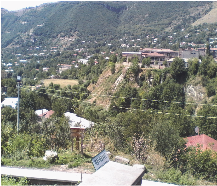
Նկ.4. Տարածքի ընդհանուր տեսքը հյուսիս արևելքից