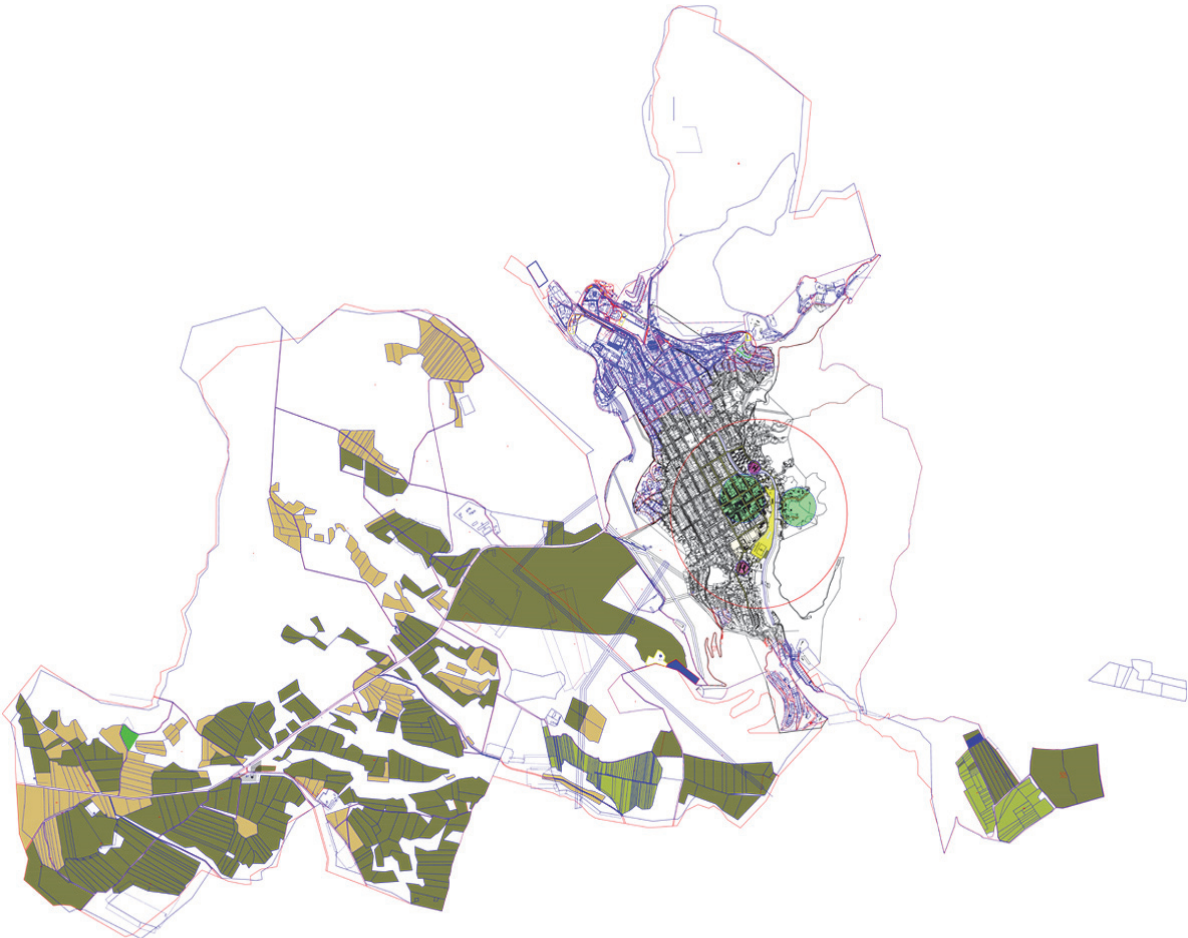
Նկ.6. Գորիս քաղաքի գլխավոր հատակագիծ