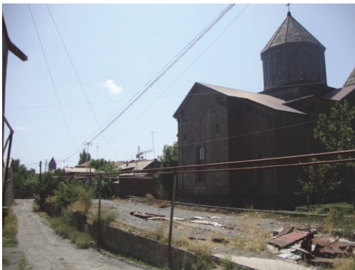
Նկ.5. Սուրբ Նշան եկեղեցի (տեսքը)