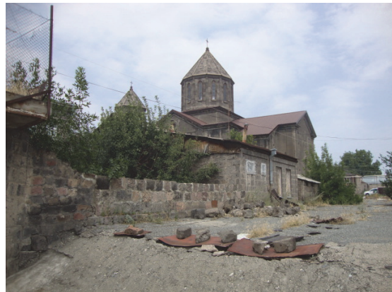
Նկ.25. Ռուսթավելի-Գորկի փողոցի հետին հատված (տեսքը)