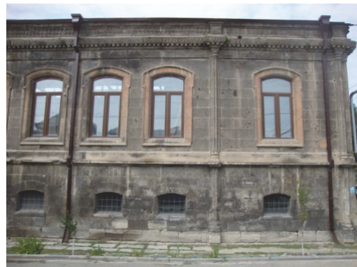
Նկ.17,18. «Հայկական ավանդական խեցեգործության հետազոտական կենտրոն» (Վարպետաց փողոց 45)