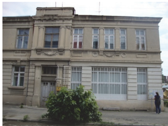
Նկ.19. Գորկի-Վարպետաց փողոցների վրա շինություն (անկյուն)