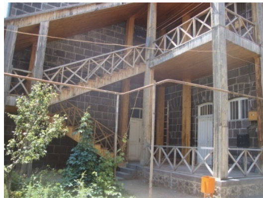
Նկ.8. Սահականուշյան օրհորդաց դպրոց (41 Արուսյան փողոց, բակ)