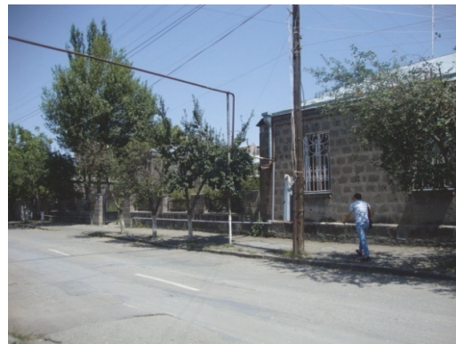
Նկ.6. Վարպետաց փողոցի տեսքը