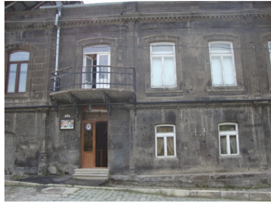
Նկ.15,16. Միեր Մկրտչյանի տուն-թանգարան (Ռուսթավելի փողոց 30)