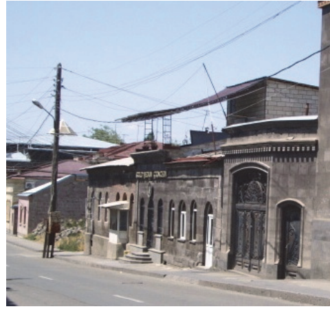
Նկ.9,10 Բնակելի տուն (Գորկի փողոց 41-43)