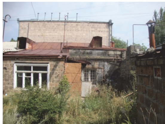
Նկ.13,14. Երկու բնակելի տուն (Վարպետաց փողոց 47)