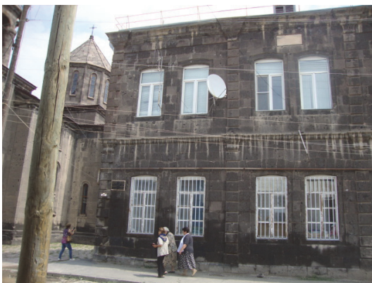
Նկ.7. Սահականուշյան օրհորդաց դպրոց (41 Արուսյան փողոց, առաջամաս)