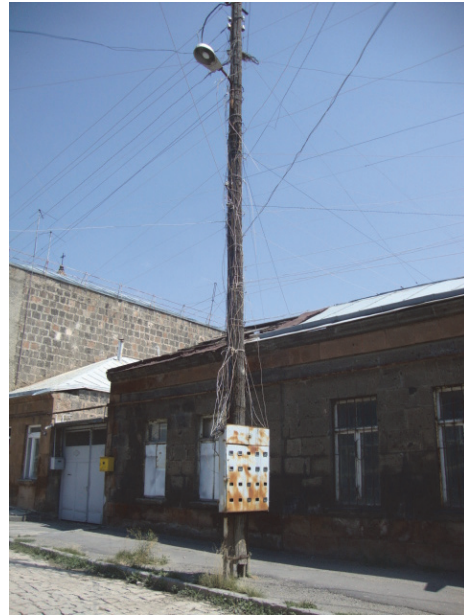
Նկ.4. Արուսյան փողոցի տեսքը