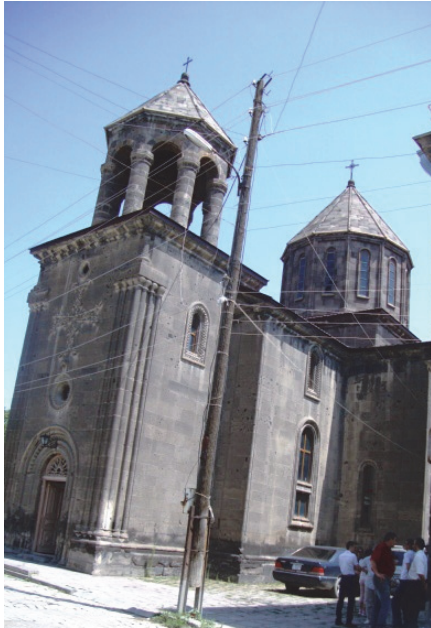
Նկ.3. Սուրբ Նշան եկեղեցի