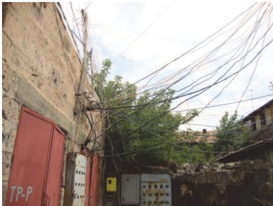
Նկ.24. Ռուսթավելի-Գորկի փողոցի հետին հատված (տեսքը)