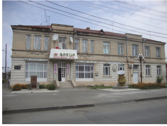
Նկ.21,22. Աբովյան-Գորկի փողոցների վրա շինություն (անկյուն)