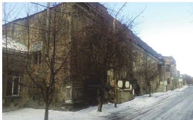
Նկ. 5, 6, 7, 8, 9. Բնակելի տուն և ռեստորան Շիրազի 30 հասցեում, Լուս.՝ Լ. Իգիթյան, 2016 և Ա. Միրզոյան, 2017