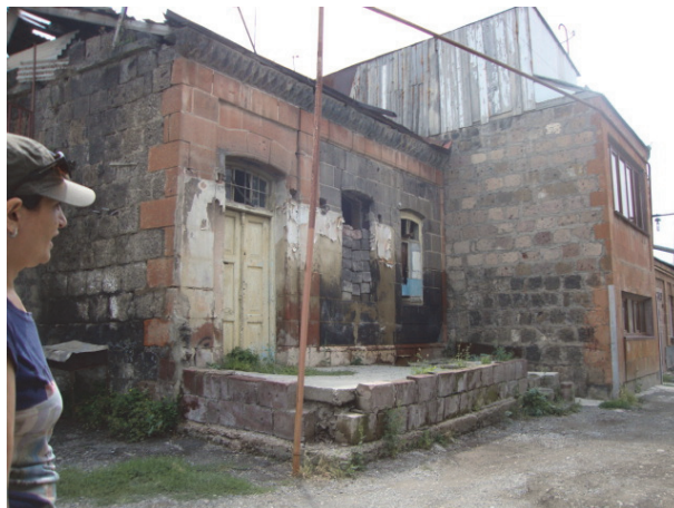
Նկ. 10, 11, 12, 13, 14. Բնակելի տուն Ճիրազի 90 հասցեում