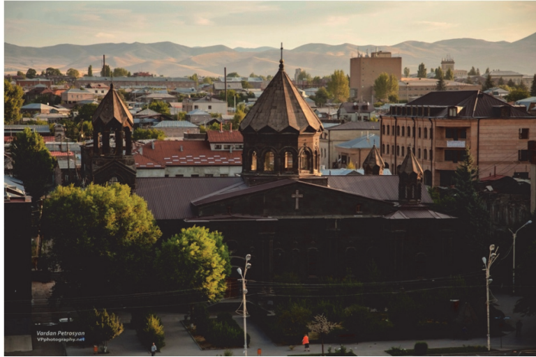
Նկ.1. Գյումրի (ընդհանուր տեսարան)