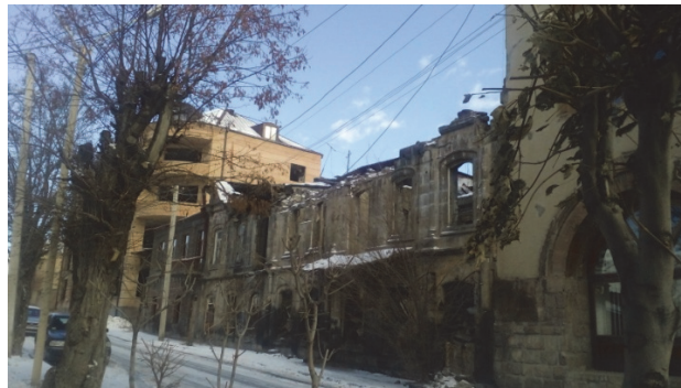
Նկ. 2, 3, 4. Բնակելի տուն Վարպետաց 119 հասցեում, 2017