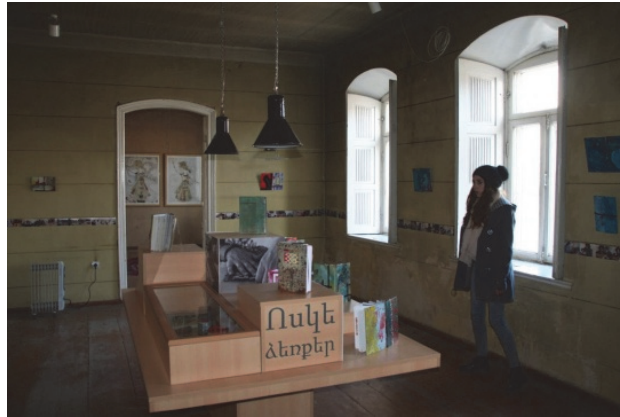
Նկ. 17. Հայփի Փոփ Ափ Գեւերի, Լուս.՝ Ա. Քրուզ, 2016

կառավարությանն առընթեր քաղաքաշինության կոմիտե), այնպես էլ հասարակական (օրինակ՝ «Ճիրակ կենտրոն» ՀԿ) և շահագրգիռ կազմակերպություններին ու անձանց: