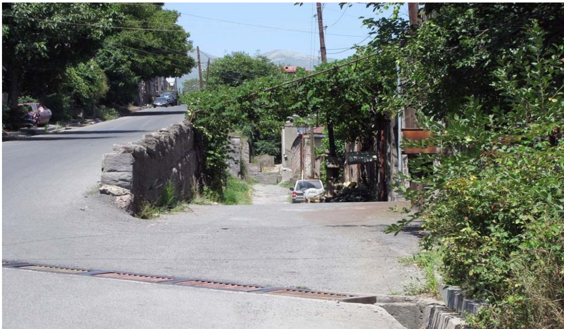
Նկ.5. Սյունիք փողոց