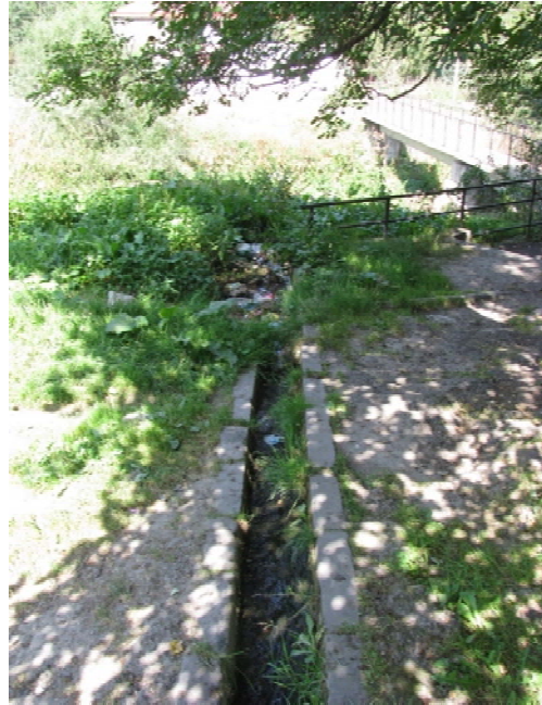
Նկ.3,4. Դրենաժային առվակներ