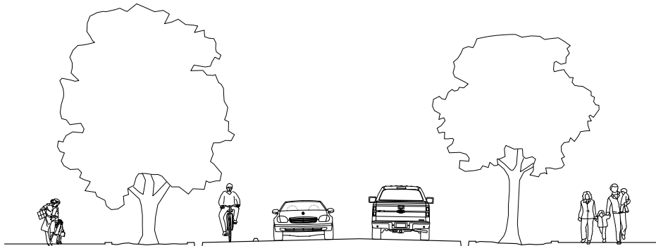
Նկ. 2. Գործիսի փողոցներից մեկի վերակառուցման պլանի օրինակ