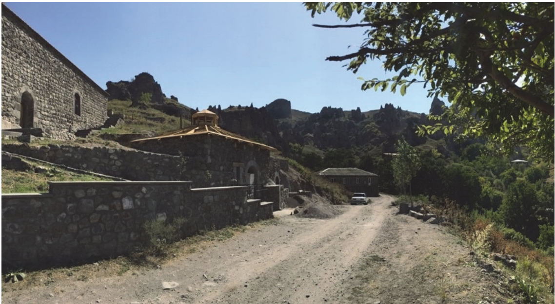
Նկ. 3. Սուրբ Հռիփսիմե եկեղեցի