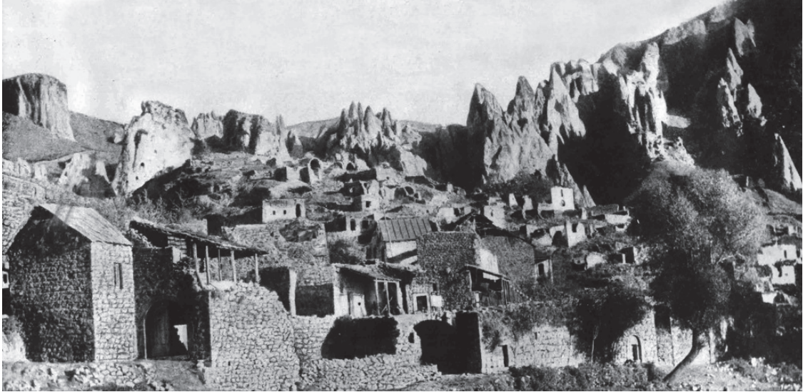
Նկ.2. Հին Գորիսի համայնապատկերը (19-րդ դար)