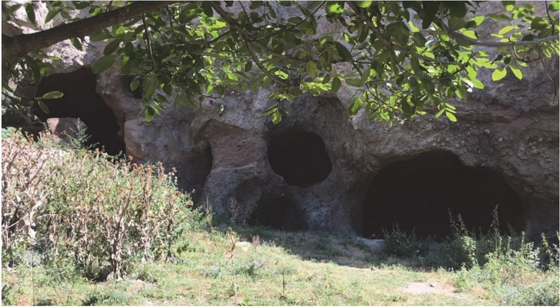
Նկ. 4. Գորիս, Քարանձավային քաղաք, ամֆիթատրոն