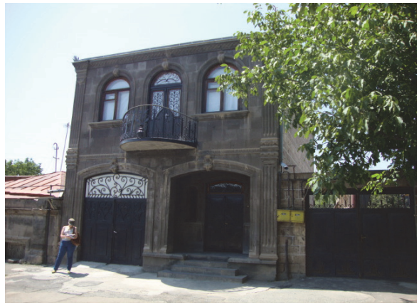
Նկ.10. Նորակառույց առանձնատուն