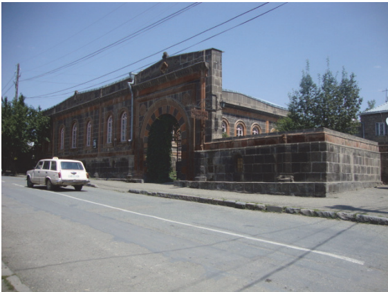
Նկ.7. Հ. Ճիրազի հուշաթանգարան