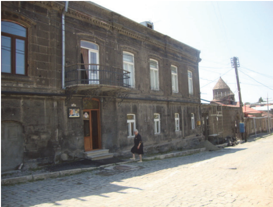
Նկ.3. Ռուսթավելի-Վարպետաց փողոցների անկյունի շենք փողոցների անկյունի շենք