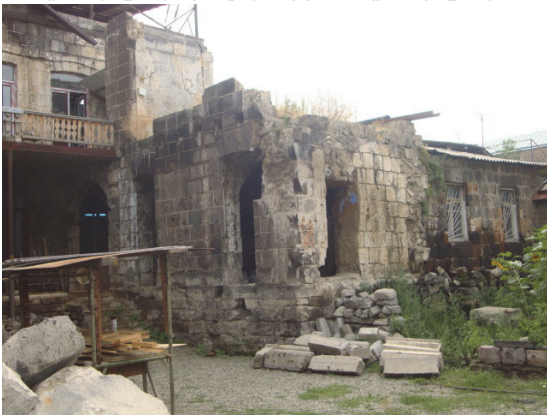
Նկ.5. Ռուսթավելի-Վարպետաց փողոցների անկյունային շենքի բակը