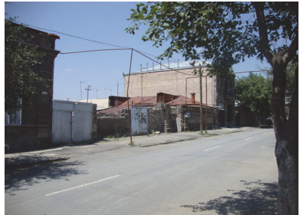
Նկ.8. Խարխլված բնակելի առանձնատուն