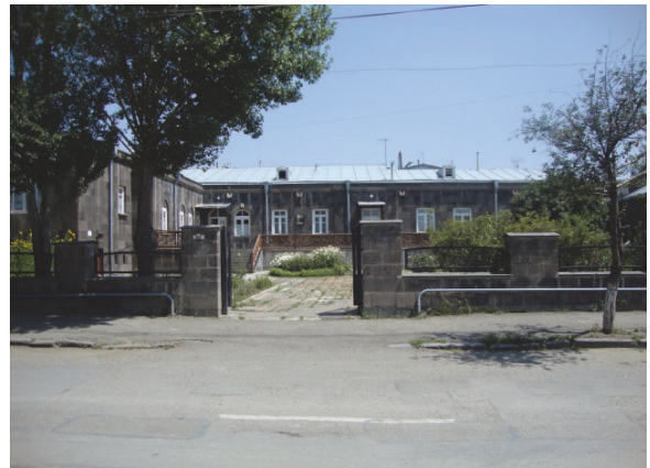
Նկ.6. Ավ. Իսահակյանի տուն-թանգարան