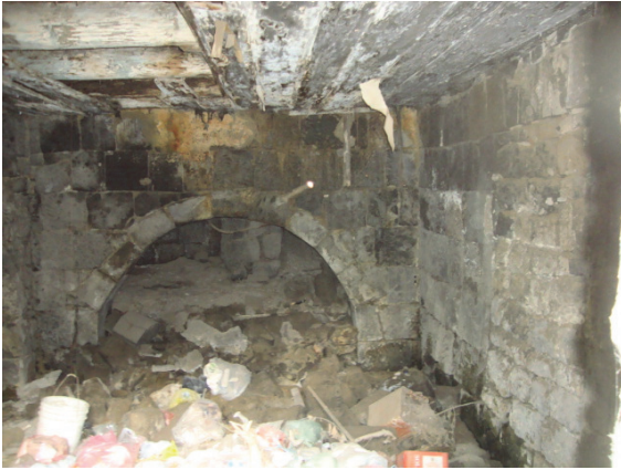
Սկար 8. Հուշարձանի կամարակապ սկուղը