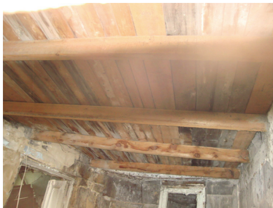
Նկար 7. Փայտե գերաններով միջհարկային ծածկ