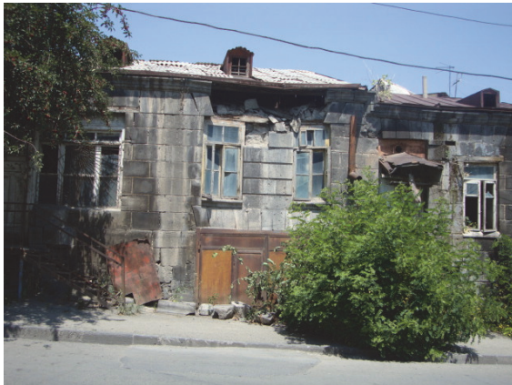
Նկար 5. Հուշարձանի բացվածքները