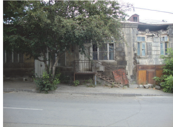
Նկար 3,4. Հուշարձանի ընդհանուր տեսքը Շիրազի փողոցի կողմից