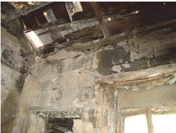
Սկար 10. Քայքայված ծայեղնաձածկեր