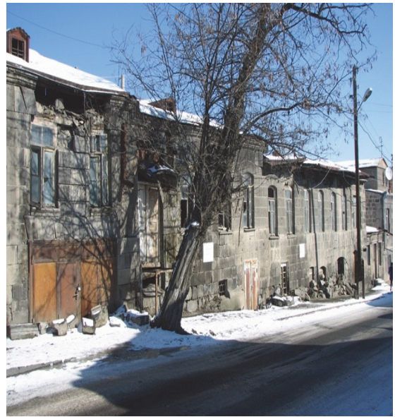
Նկ.2. Շիրազի 17 տունը