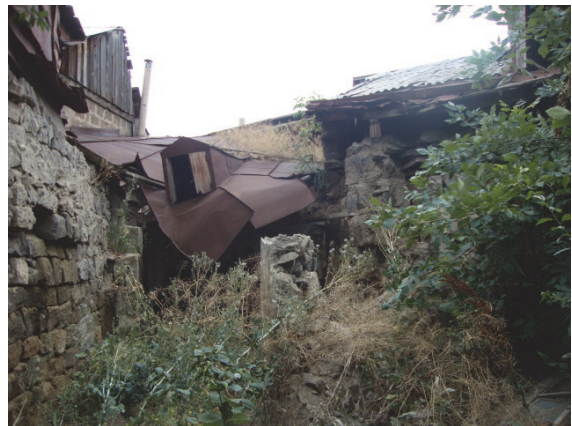
Սկար 11. Հուշարձանի տեսքը բակի կողմից