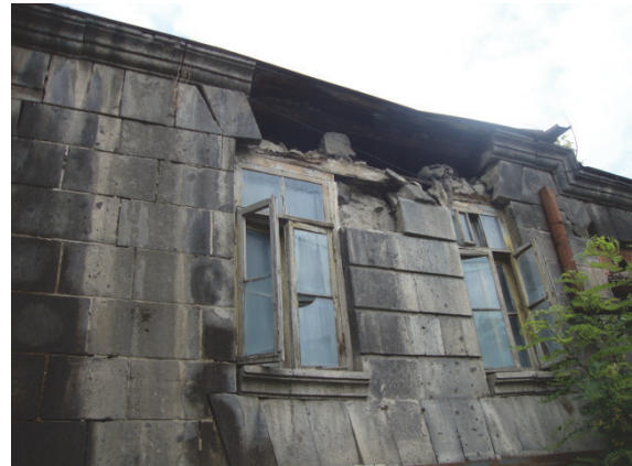
Նկար 6. Մուտքը դեպի բակ