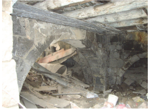
Սկար 9. Հուշարձանի կամարակապ սկուղը