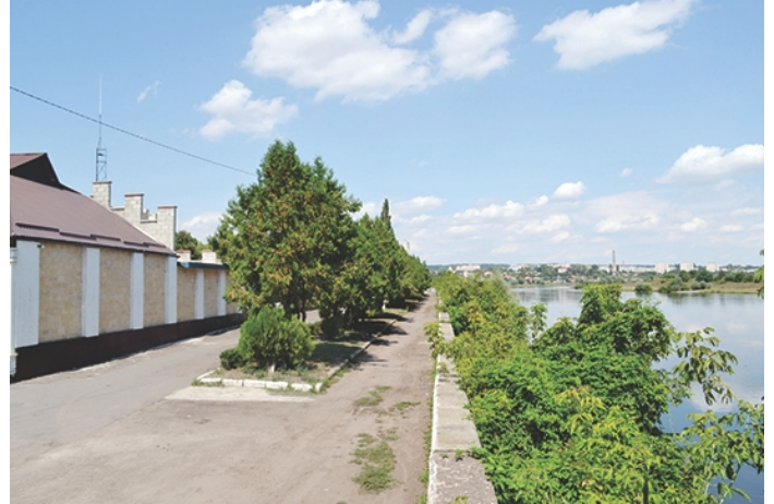
Strada Malul Nistrului se află într-o stare fizică precară: acoperirea asfaltică este deteriorată, iar vegetația este în paragină