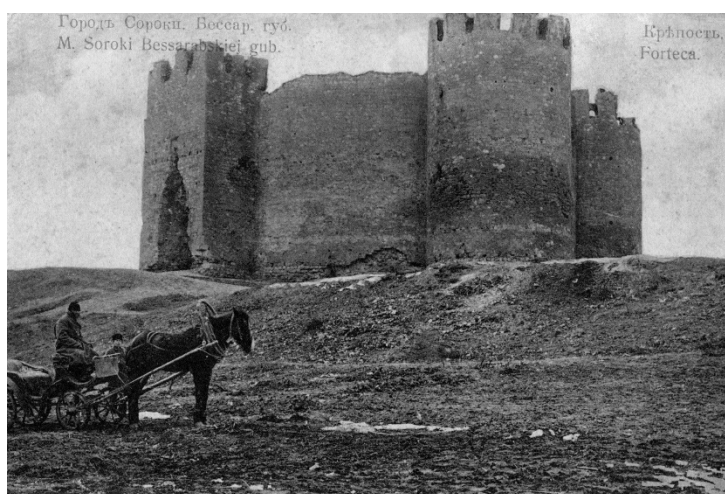
Imagini ale Cetății Soroca și ale fluviului Nistru în perioada țaristă