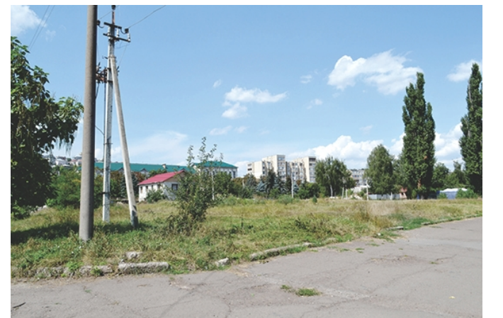
Spațiile publice de-a lungul fluviului Nistru ar putea găzdui activități recreționale de amploare redusă sau mare, însă în prezent sunt neglijate