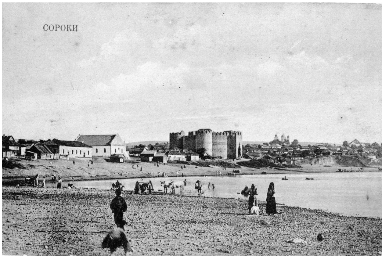
Cetatea Soroca și sinagoga (demolată) în secolul al XIX-lea