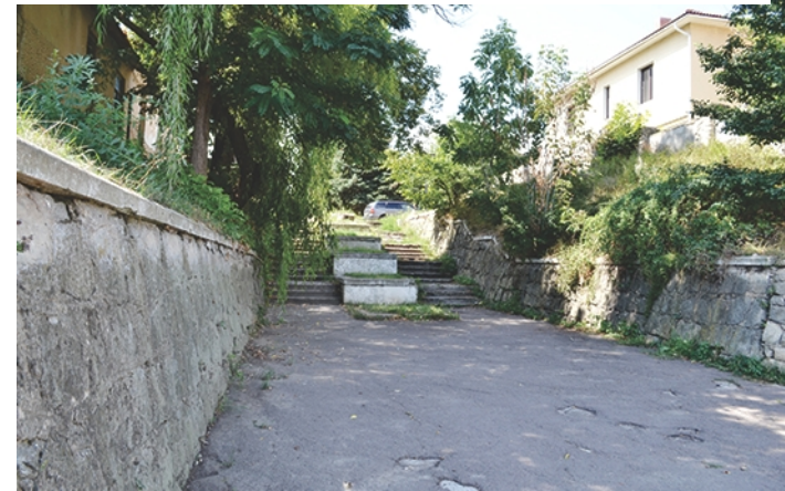
Scările de acces la apă și la orașul interior sunt deteriorate și neatractive