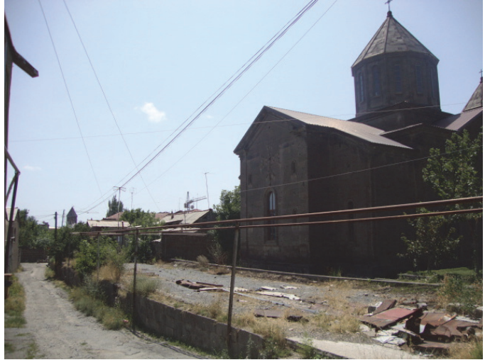
Նկ 4. Սր Նշան եկեղեցին