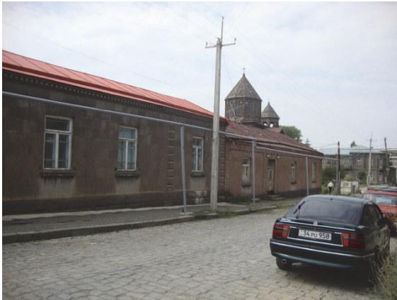
Նկ 13. Վարպետաց փողոցի բնակի ճակատը