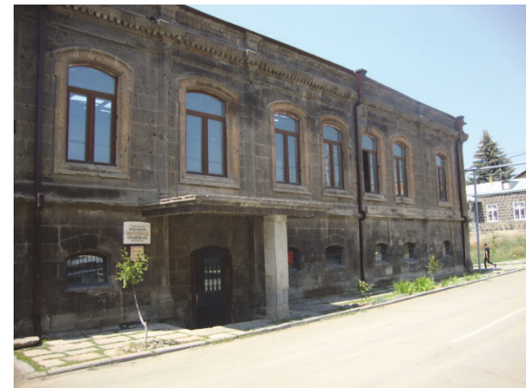
Նկ 10 . Վարպետաց փողոցի բնակելի տուն