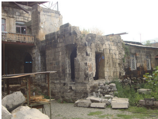
Նկ 11 . Վարպետաց փողոցի բնակելի տուն