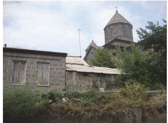
Նկ 14. Վարպետաց փողոցի բնակելի տան բակը