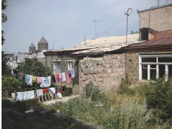
Նկ 7. Շիրազի փողոցի բնակելի տունը