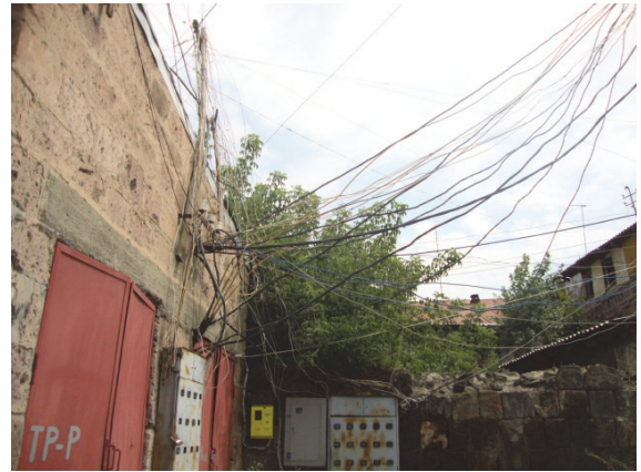
Նկ 20. Աբովյան փողոց , երկհարկանի բնակելի տուն