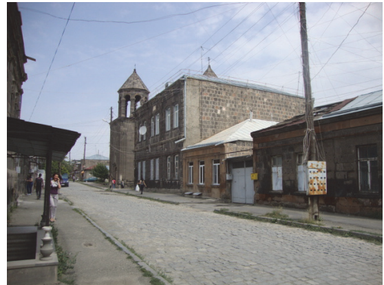
Նկ 6. Աբովյան 41 հասցեի շենքը