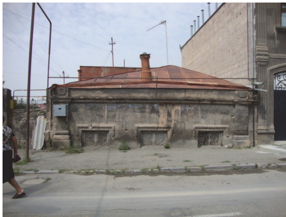
Նկ 9 . Վարպետաց փողոցի բնակելի տան բակը