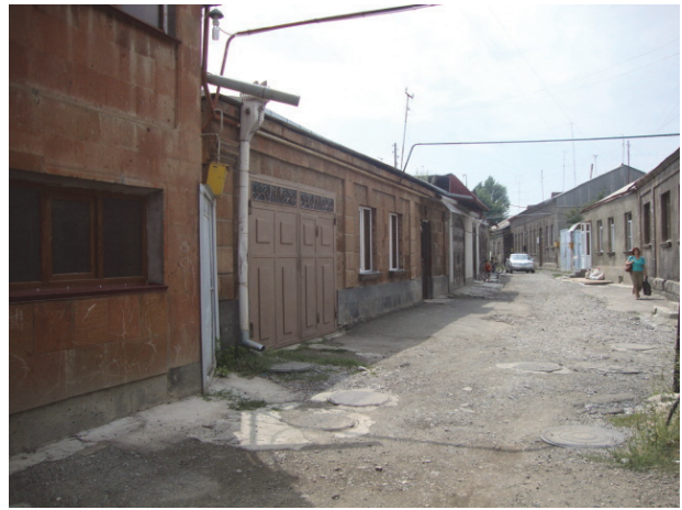
Նկ.2. Ռուսթավելի-Շիրազ /Գորկի/ նրբանցք