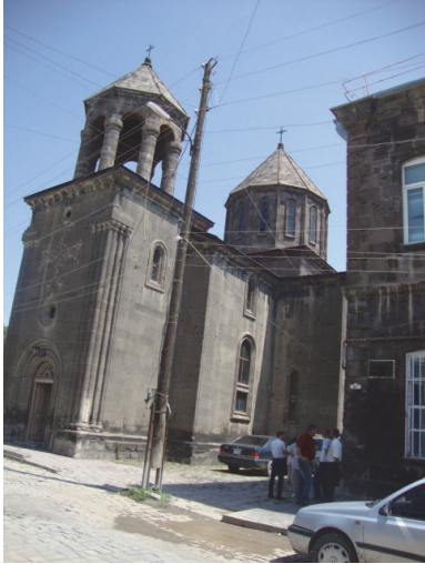
Նկ 3. Սր Նշան եկեղեցին