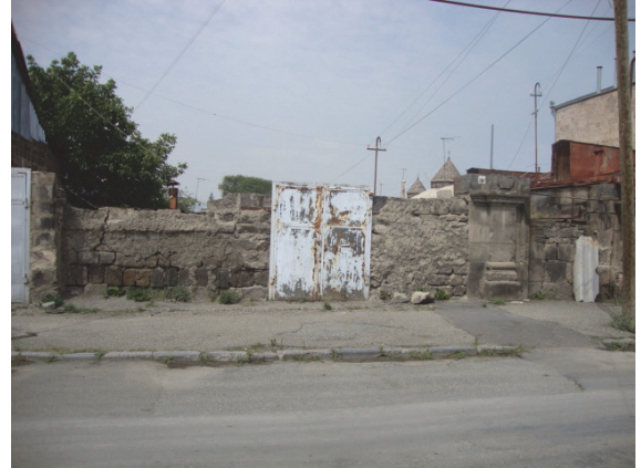
Նկ 8. Շիրազի փողոցի 90 հասցեի բնակելի տունը