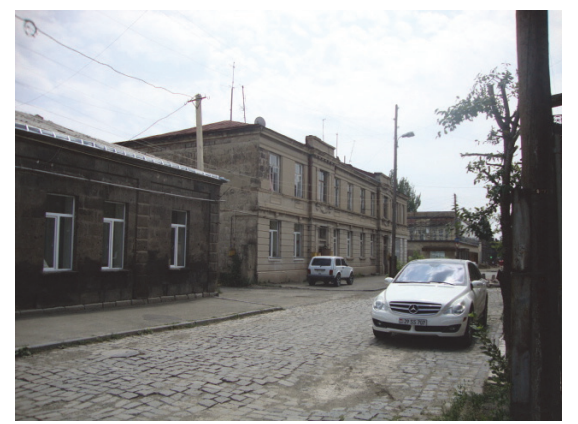
Նկ 17. Սբ Նշան եկեղեցու հարակից տարածքի կառուցապատում /ոչ հուշարձան/