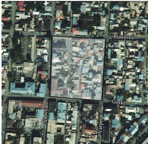
Նկ.1. Տեղադիրքը (սև եզրագիծ)