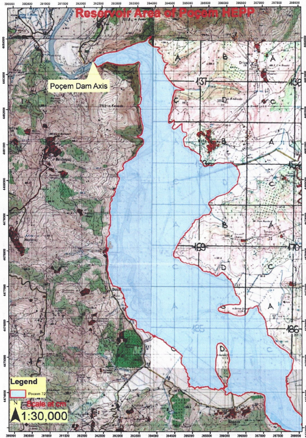
Figura 3. Harta topografike e zones se rezervuarit te H/C Poçem