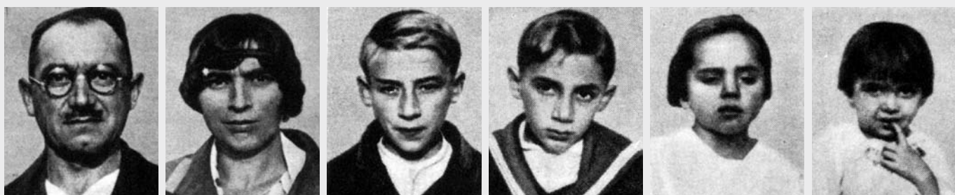
III. 5 Fotografier av en "zigenarfamilj" från en artikel av Guido Landra. Dessa fotografier skulle "bekräfta zigenarnas underlägsenhet". (ur Boursier 1999, s. 16)

igen, mellan 1928 och 1940. Efter 1940 följdes arresteringen av internering enligt inrikesdepartementets förordning från september 1940. [III.3]