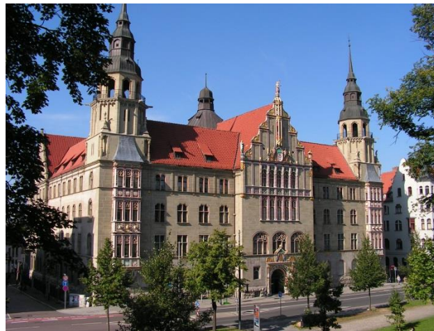
Sąd Krajowy Halle Hansering 13