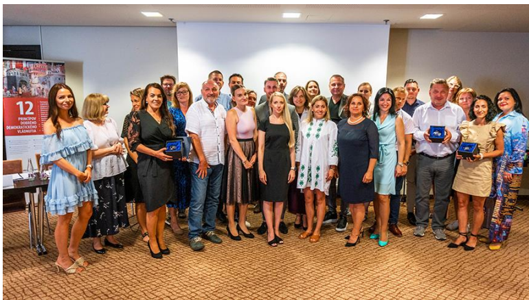
2e cycle ELoGE en Slovaquie - Cérémonie de remise des prix

L'ensemble complet de recommandations concrètes devrait aider le gouvernement slovaque à prendre une décision éclairée sur la réforme en cours concernant le système national de gouvernance à plusieurs niveaux, conformément aux normes du Conseil de l'Europe sur la bonne gouvernance démocratique et aux pratiques européennes les plus pertinentes. En plus des recommandations politiques, le CEBG a simultanément mis en œuvre différents outils de renforcement des capacités pour les autorités locales, en coopération avec plusieurs organisations partenaires locales. Ces outils touchent des domaines tels que : La planification municipale stratégique , le benchmarking de l'éthique publique , le benchmarking des finances locales , la préparation de différents programmes de formation nationaux et la mise en œuvre du deuxième cycle d' ELoGE dans le pays.