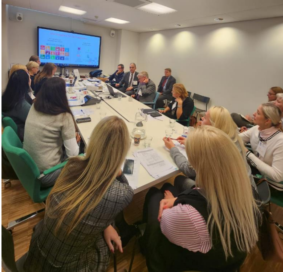
Visite d'étude en Finlande

La dimension régionale de la visite d'étude a suscité l'intérêt des autorités d'accueil et leur a été profitable, comme l'ont confirmé les homologues finlandais.