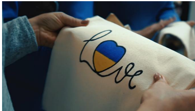
Communauté de Horodok, région de Khmelnytskyi)

Indépendamment du contexte volatile et en constante évolution, le CEBG est donc resté le principal conseiller du gouvernement et du parlement ukrainiens en matière de promotion du respect de la bonne gouvernance démocratique.