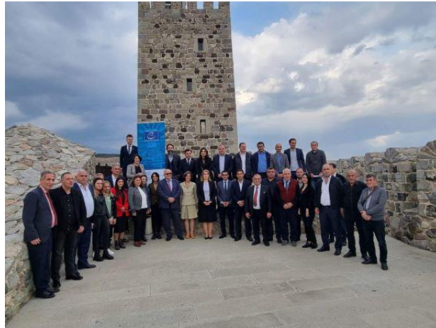
Leadership pour la coopération transfrontalière, étape 2, Géorgie