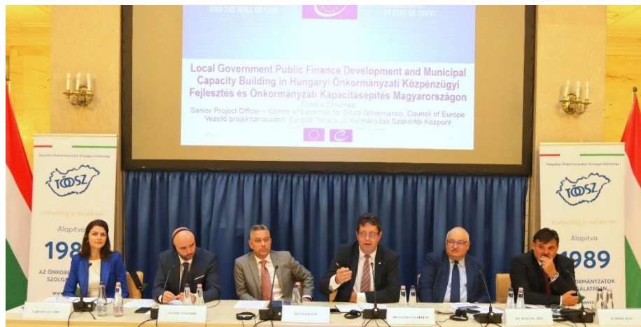
Conférence de lancement du projet à Budapest

Un nouveau projet intitulé " Développement des finances publiques des collectivités locales et renforcement des capacités municipales en Hongrie ", cofinancé par le Conseil de l'Europe et l'Union européenne, a été lancé en septembre 2022. Il a été développé en étroite collaboration avec le principal bénéficiaire, l'Association nationale hongroise des autorités locales (TÖOSZ), et vise à renforcer les capacités administratives et financières des municipalités en Hongrie.