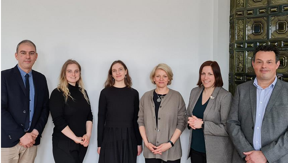
ELoGE - formation des formateurs