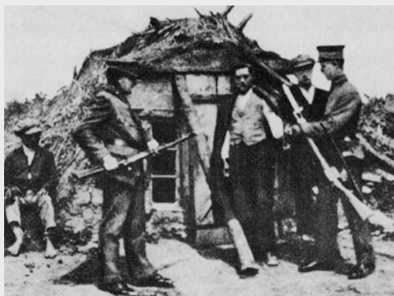
III. 6 (katar Mayerhofer, p.178)

Lista romane murŝenca andar o gav Spitzzicken andar Burgenland save sas deportime and-e butjake lagerja, special and-i Styria, 1942.