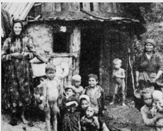
Ilustr. 3 (extras din Mayerhofer 1988, pag.37)

Punct de populare la Mattesburg, Burgenland, între cele două războaie mondiale. Fotografia reprezintă cele trei tipuri de locuință, folosite în epocă: la stânga o casă de paiantă, văruiță, din cărămizi de argilă, în mijloc un bordei (colibă pe jumătate îngropată în pământ, construită în lemn în șarpantă, cu crengi împletite și argilă), la dreapta - o construcție formată dintr-un ansamblu de camere cu șarpantă, având spațiile goale umplute cu zidărie de ipsos, lemn și argilă.