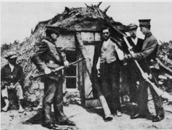
Ilustr.6 (după Mayerhofer 1988, pag.178)

Listă cu romii de sex masculin din satul Spitzzicken (Burgenland), deportați către zonele de muncă, situate, cele mai multe în Stiria, 1942.