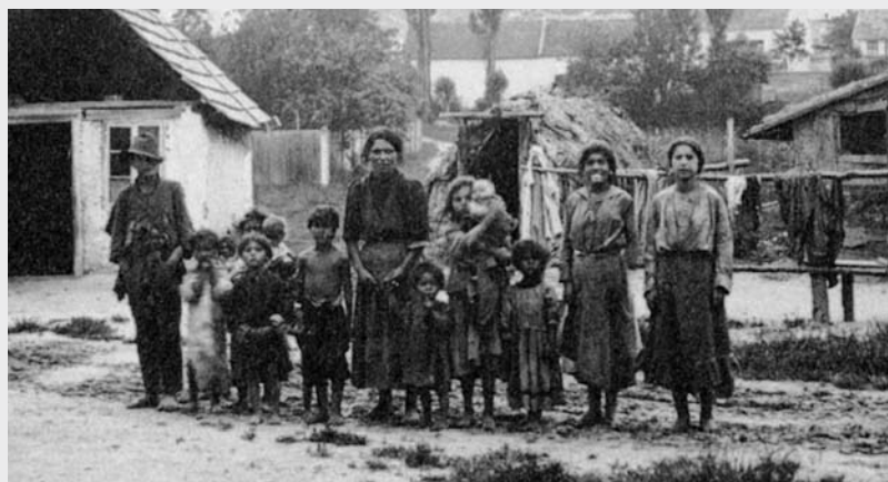
Ilustr. 4 (extras din Mayerhofer 1988, pag.184)