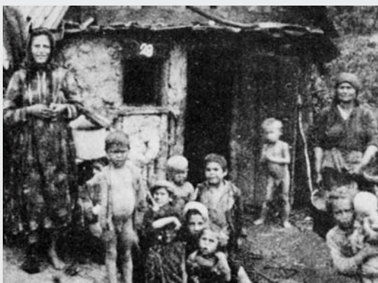
III. 3 (nga Mayerhofer 1988, f. 37)

Vendosja në Mattersburg, Burgenland, në mes të luftërave. Piktura tregon tri dizajne të ndryshme të vendbanimeve që ekzistonin atëherë: majtas, një shtëpi e suvatur dhe e gëlqerosur prej tullave të baltës, në mes një “putri”, një kasolle gjysmë e futur në tokë, gjysmë e bërë nga druri, degët dhe balta, djathtas, një ndërtesë e mbushur me baltë, dhe gjysma e ndërtuar me trarë.