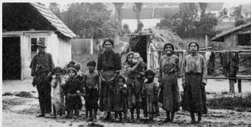
III. 4 (nga Mayerhofer 1988, p. 184)